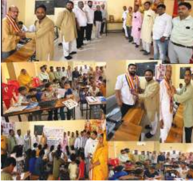
समाज का मानना है कि शिक्षित समाज ही सशक्त राष्ट्र की नींव रख सकता है।

उल्लेखनीय है कि ज्वालियर युवा विंग के सदस्यों ने अपने निजी कोष और आपसी सहयोग से इस निःशुल्क कोचिंग क्लास की व्यवस्था की है।