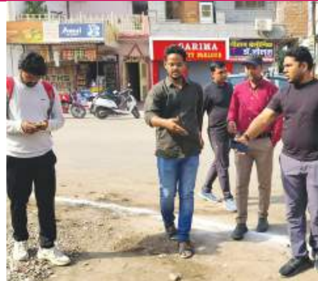
जिससे उनकी हाजिरी चेक की जा सके। डब्ल्यूएचओ से कर्मचारियों की संख्या पूछने पर उसने बताया कि वार्ड में 45 कर्मचारी काम कर रहे हैं। कर्मचारियों की गिनती करने पर आधे कर्मचारी गायब मिले। इसके बाद उन्होंने शब्दप्रताप आश्रम स्थित नाले का निरीक्षण किया, वहां उन्हें गंदगी मिली। निरीक्षण के दौरान

अपर आयुक्त टी प्रतीक राव ने शनिवार सुबह शहर में सफाई व्यवस्था का निरीक्षण किया, निरीक्षण के दौरान उन्होंने कटी घाटी स्थित पार्क को देखा। पार्क में उन्हें गंदगी मिली, जिसे देखकर उन्होंने डब्ल्यूएचओ को फटकार लगाई, साथ ही पार्क की गंदगी को साफ करने के निर्देश दिए। साथ ही हॉल्कर्स जोन में भी गंदगी मिली, जिसे साफ करने के निर्देश दिए गए। इसके बाद उन्होंने विनय नगर का निरीक्षण किया। निरीक्षण में उन्हें कर्मचारी काम करते हुए नहीं दिखे। उन्होंने डब्ल्यूएचओ को निर्देश दिए कि सभी कर्मचारियों को बुलाया जाए।