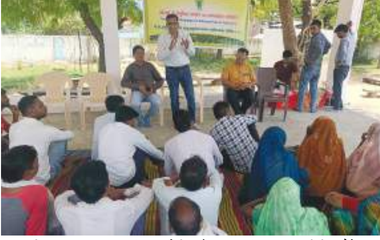
लाभ, हरी खाद, फसल चक्र तथा टिकाऊ खेती के महत्व पर विस्तृत जानकारी दी। उन्होंने बताया