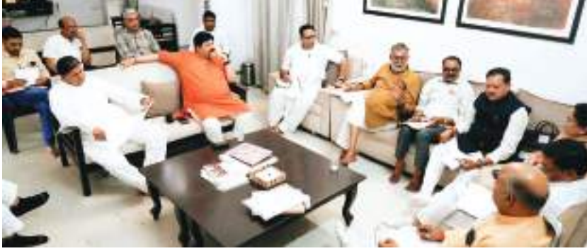
ढांचे को मजबूत करने पर जोर दिया। भोपाल अत्यंत महत्वपूर्ण बैठक आयोजित की गई। इस स्थिति निवास पर भिण्ड कोर कमटी की एक उच्च स्तरीय बैठक में भिण्ड जिले के समग्र

पंचायत एवं ग्रामीण विकास और श्रम तथा भिण्ड जिले के प्रभारी मंत्री प्रहलाद सिंह पटेल के मार्गदर्शन में क्षेत्र के विकास को नई गति देने की कार्ययोजना बनाई गई। इस बात पर विशेष बल दिया गया कि शासन की कल्याणकारी योजनाओं का लाभ समाज के अंतिम छोर पर बैठे हर पात्र और जरूरतमंद व्यक्ति तक पूरी पारदर्शिता के साथ पहुंचे। प्रभारी मंत्री पटेल ने जनसमस्याओं के त्वरित और समयबद्ध समाधान तथा बुनियादी