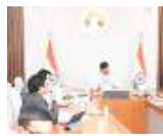
मुख्यमंत्री के प्रमुख निर्देश

मुख्यमंत्री डॉ. मोहन यादव के नेतृत्व में मध्यप्रदेश सरकार अब कुटीर एवं ग्रामोद्योग क्षेत्र को रोजगार, नवाचार और बाजार से जोड़कर नया स्वरूप देने जा रही है। पारंपरिक शिल्प को आधुनिक सोच के साथ आगे बढ़ाने और ग्रामीण कारीगरों को बेहतर आय और पहचान दिलाने के लिये निरंतर कार्य किये जा रहे हैं। मुख्यमंत्री डॉ. यादव के नेतृत्व में मध्यप्रदेश की पहचान महेश्वरी, चंदेरी, खादी और रेशम जैसे उत्पादों को सिर्फ संरक्षित ही नहीं, बल्कि विस्तारित और प्रतिस्पर्धी बनाया जा रहा है।