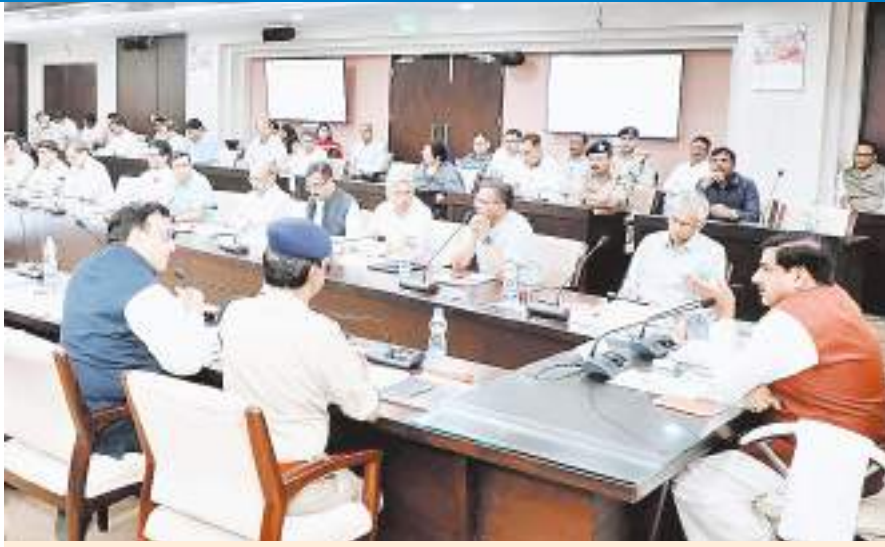
होमगार्ड बल का क्षमता संवर्धन होगा

मुख्यमंत्री डॉ. यादव ने कहा कि ग्रामीण क्षेत्रों में आबादी की निःशुल्क रजिस्ट्री के कार्य का लाभ प्रदेश के सभी ग्रामवासियों को दिलवाने के लिये अभियान के स्वरूप में संचालित किया जाए। लोकहित के इस कार्य में जनप्रतिनिधियों-पंचायत प्रतिनिधियों की सहभागिता आवश्यक रूप से सुनिश्चित की जाए। मुख्यमंत्री डॉ. यादव ने कहा कि स्वामित्व योजना में महिलाओं के नाम रजिस्ट्री कराई जाए। ग्रामीण