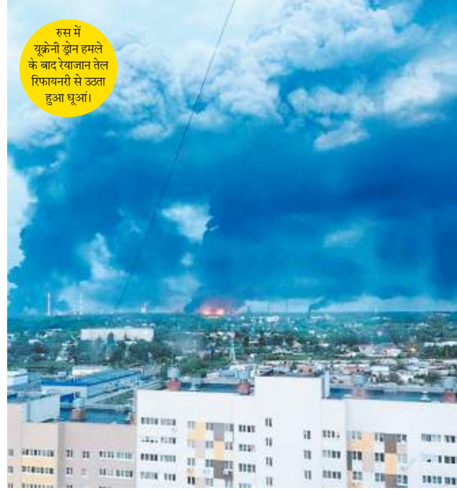
रूस में यूक्रेनी ड्रोन हमले के बाद रेयाजान तेल रिफायनरी से उड़ता हुआ धूआं।

संयुक्त राष्ट्र की रिपोर्ट के अनुसार, मृतकों में 10 आम नागरिक भी शामिल हैं, जिनमें महिलाएं और एक छोटी बच्ची भी है। इन इलाकों में पिछले दो वर्षों से आपराधिक गिरोहों का वर्चस्व बढ़ता जा रहा है, जिससे सामान्य जनजीवन पूरी तरह अस्त-व्यस्त हो गया है। हालात इतने बेकाबू हो चुके हैं कि लोग अपनी जान बचाने के लिए सामूहिक पलायन कर रहे हैं। ताजा आंकड़ों के मुताबिक, हिंसा के डर से अब तक करीब 5300 लोग अपना घर-बार छोड़कर विस्थापित हो चुके हैं।