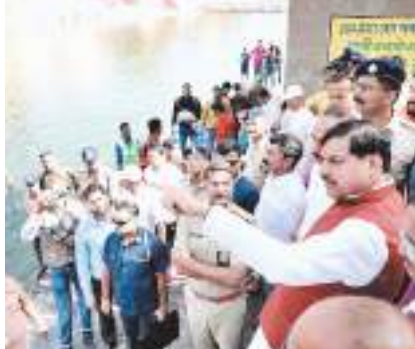
जनता और जनप्रतिनिधि पेश कर रहे नई मिसाल

मध्यप्रदेश के मुख्यमंत्री डॉ. मोहन यादव ने शुक्रवार को उज्जैन प्रवास के दौरान सिंहस्थ-2028 की तैयारियों का जायजा लिया। मुख्यमंत्री ने हरसिद्धि पाल से रामघाट मार्ग के चौड़ीकरण कार्य का ग्राउंड जीरो पर पहुंचकर निरीक्षण किया और अधिकारियों को आवश्यक दिशा-निर्देश दिए। इस दौरान उन्होंने विकास कार्यों में स्थानीय नागरिकों और जनप्रतिनिधियों द्वारा मिल रहे सहयोग की खुलकर सराहना की। निरीक्षण के बाद मीडिया से चर्चा करते हुए मुख्यमंत्री डॉ. मोहन यादव ने कहा कि सिंहस्थ-2028 में आने वाले करोड़ों श्रद्धालुओं और स्थानीय नागरिकों की सुविधाओं को ध्यान में रखकर घाटों और मार्गों के चौड़ीकरण का कार्य किया जा रहा है। उन्होंने स्पष्ट किया कि सरकार इन सभी विकास कार्यों की सतत मॉनिटरिंग कर रही है। सिंहस्थ के सभी निर्माण कार्य इस तरह से प्लान किए जा रहे हैं जिससे पौराणिक और धार्मिक नगरी उज्जैन को आगामी लंबे समय तक इसका लाभ मिलता रहे।