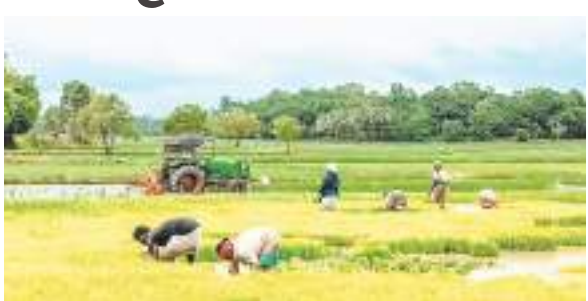
आर्थिक स्थिति मजबूत करने का सबसे प्रभावी माध्यम बन सकती है। ग्रामीण अर्थव्यवस्था की मुख्यधारा से जोड़ने पर जोर

खेती के साथ अधिक लाभकारी उद्यानिकी गतिविधियों से जोड़कर उनकी आय में उल्लेखनीय वृद्धि सुनिश्चित करना है। उद्यानिकी एवं खाद्य प्रसंस्करण विभाग तैयार की गई कार्य योजना के अनुसार फल फसलों के क्षेत्र में 18 हजार हैक्टियर, सब्जी उत्पादन में 54 हजार हैक्टियर, मसाला फसलों में 56 हजार हैक्टियर, पुष्प उत्पादन में 3 हजार 500 हैक्टियर, औषधीय फसलों में 600 हैक्टियर तथा संरक्षित खेती में 47 हैक्टियर क्षेत्र वृद्धि का लक्ष्य रखा गया है। प्रदेश सरकार का मानना है कि बदलते कृषि परिदृश्य में उद्यानिकी फसलों किसानों की