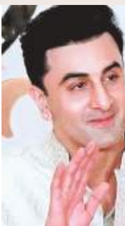
पांच एकड़ में बनने वाला शुद्ध शाकाहारी लज्जरी होटल शामिल है। गौरतलब है कि यह इन्वेस्टमेंट ऐसे समय में सामने आया है, जब रणबीर डायरेक्टर नितेश तिवारी की फिल्म रामायण में भगवान श्रीराम की भूमिका निभा रहे हैं।

सत्ता सुधार ■ अयोध्या अभिनेता रणबीर कपूर ने अयोध्या के रियल एस्टेट प्रोजेक्ट द सरयू में जमीन खरीदी है। यह प्रोजेक्ट द हाउस ऑफ अभिनंदन लोढ़ा का प्रीमियम प्लॉट डेवलपमेंट प्रोजेक्ट है। कंपनी की आधिकारिक घोषणा के अनुसार, यह डील 3.31 करोड़ रुपए में हुई है। खरीदी गई जमीन का कुल क्षेत्रफल 2,134 वर्ग फीट है। अमिताभ बच्चन के बाद द सरयू में निवेश करने वाले रणबीर कपूर दूसरे बड़े अभिनेता बने हैं। द सरयू 75 एकड़ में फैला प्रोजेक्ट है, जो सरयू नदी के किनारे स्थित है। इस प्रोजेक्ट में ग्रैंड बलब हाउस, 35 से ज्यादा लाइफस्टाइल सुविधाएं और द लीला होटलस का