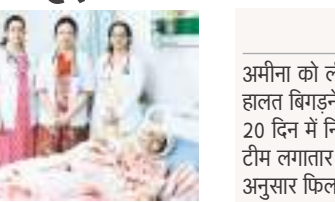
मुताबिक यह मामला इसलिए भी बेहद खास था, क्योंकि गर्भ में पल रहे चारों बच्चे अलग-अलग थैली में थे। गर्भावस्था के दूसरे महीने में अल्ट्रासाउंड के दौरान ही यह स्पष्ट हो गया था कि महिला के गर्भ में चार भ्रूण हैं।