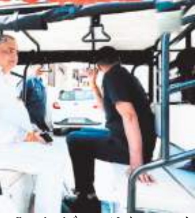
पार्टी कार्यकर्ता बैठकर मंत्री के साथ चलते दिखाई दिए। मंत्री के काफिले में ई-रिक्शा