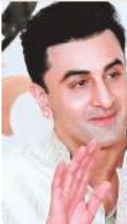
पांच एकड़ में बनने वाला शुद्ध शाकाहारी लजरी होटल शामिल है। गौरतलब है कि यह इन्वेस्टमेंट ऐसे समय में सामने आया है, जब रणबीर डायरेक्टर नितेश तिवारी की फिल्म रामायण में भगवान श्रीराम की भूमिका निभा रहे हैं।