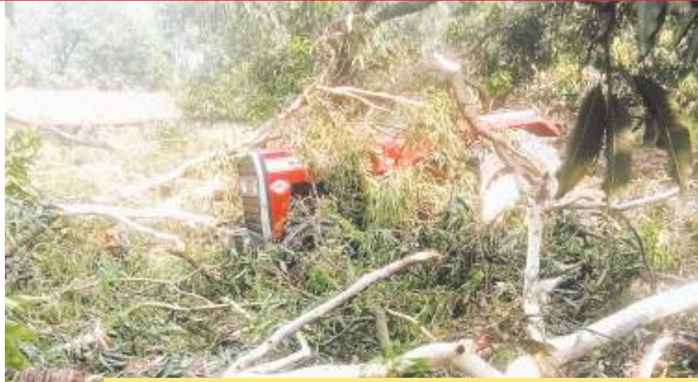
एक छात्रा की मौत

सत्ता सुधार ■ लखनऊ यूपी में अचानक मौसम ने करवट लिया और फिर जमकर तांडव मचाया। कहीं दीवार गिरी, कहीं छप्पर तो कहीं पेड़ गिरे। उन्नाव जिले में चार, फतेहपुर में चार और कानपुर देहात में दो और बरेली में दो लोगों की मौत हुई है। उत्तरप्रदेश में आंधी-बारिश का सिलसिला थम नहीं रहा। बुधवार दोपहर ढाई बजे उन्नाव में बारिश के साथ आले गिरे हैं। कानपुर में भी बरसात हुई। बरेली और लखनऊ में तेज आंधी चली। बरेली में हवा की स्पीड इतनी तेज थी कि बिजली के पोल और यूनियोपल उखड़ गए। इससे पहले सुबह संभल, मेरठ और बरेली में बारिश हुई। शाहजहापुर में धूलभरी आंधी चली। उन्नाव में आंधी-बारिश के बीच कार पर एक बड़ा पेड़ गिर गया। इसका लाइव वीडियो सामने आया है। बरेली-बदायूं में तेज आंधी में कई जगह साइन बोर्ड गिर गए।