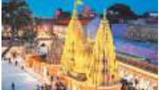
सत्ता सुधार ■ वाराणसी

भगवान शनिदेव की जयंती श्रद्धा के साथ मनाई जाएगी