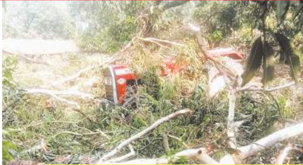
एक छात्रा की मौत

सत्ता सुधार ■ लखनऊ यूपी में अचानक मौसम ने करवट लिया और फिर जमकर तांडव मचाया। कहीं दीवार गिरी, कहीं छप्पर तो कहीं पेड़ गिरे। उन्नाव जिले में चार, फतेहपुर में चार और कानपुर देहात में दो और बरेली में दो लोगों की मौत हुई है। उत्तरप्रदेश में आंधी-बारिश का सिलसिला थम नहीं रहा। बुधवार दोपहर ढाई बजे उन्नाव में बारिश के साथ आले गिरे हैं। कानपुर में भी बरसात हुई। बरेली और लखनऊ में तेज आंधी चली। बरेली में हवा की स्पीड इतनी तेज थी कि बिजली के पोल और यूनोपोल उखड़ गए। इससे पहले सुबह संभल, मेरठ और बरेली में बारिश हुई। शाहजहापुर में धूलभरी आंधी चली। उन्नाव में आंधी-बारिश के बीच कार पर एक बड़ा पेड़ गिर गया। इसका लाइव वीडियो सामने आया है। बरेली-बदायूं में तेज आंधी में कई जगह साइन बोर्ड गिर गए।