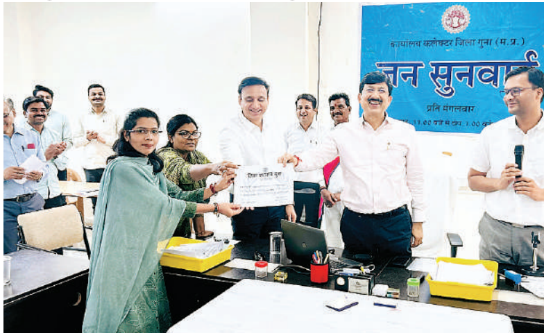
कार्ड बनाये गये तथा प्रधानमंत्री शहरी एवं ग्रामीण आवास योजना अंतर्गत 26 आवेदन प्राप्त हुए।

कलेक्टर श्री कन्याल ने नागरिकों की सुविधा को ध्यान में रखते हुए जनसुनवाई में स्वास्थ्य शिविर एवं आधार कार्ड हेल्प डेस्क के निर्देश दिए हैं। जिसके क्रम में आज जनसुनवाई कक्ष के बाहर स्वास्थ्य विभाग द्वारा 70+ आयुष्मान कार्ड, नेत्र परीक्षण केंद्र, प्रधानमंत्री शहरी आवास एवं आधार कार्ड हेल्प डेस्क लगाकर आमजनों को आधार कार्ड बनाने की सुविधा उपलब्ध करायी गई। आज स्वास्थ्य शिविर में लोगों का परीक्षण किया गया। इसी प्रकार नेत्र परीक्षण शिविर में 06, आधार कार्ड में लगभग 70 से अधिक लोगों को टोकन वितरित कर आधार