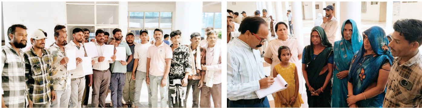
बिजली कनेक्शन की मांग को लेकर कलेक्टर पहुंचे पिपरिया गांव के ग्रामीण

जिले में प्रजापति सहकारी समिति के सदस्यों ने मंगलवार को आयोजित जनसुनवाई में कलेक्टर को ज्ञापन सौंपा। समिति ने शासन से पूर्व में आवंटित भूमि को पुनः चिह्नित करने और ईंट-भट्टा संचालन की अनुमति देने की मांग की। समिति के अनुसार, वर्ष 2009-10 में शासन द्वारा ग्राम मावन करैया में तीन हेक्टेयर भूमि आवंटित की गई थी, लेकिन हाल ही में इस भूमि को सीमेंट फैक्ट्री को दे दिया गया, जिससे समाज के कई परिवार आजीविका संकट का सामना कर रहे हैं। समाज के लोगों का कहना है कि ईंट-भट्टा व्यवसाय उनकी परंपरागत जीविका का साधन है, लेकिन वर्तमान में भूमि उपलब्ध न होने के कारण वे रोजगार संकट से जूझ रहे हैं। ज्ञापन में मांग की गई कि पूर्व में आवंटित भूमि को पुनः चिह्नित कर लाल स्याही में दर्शाया जाए