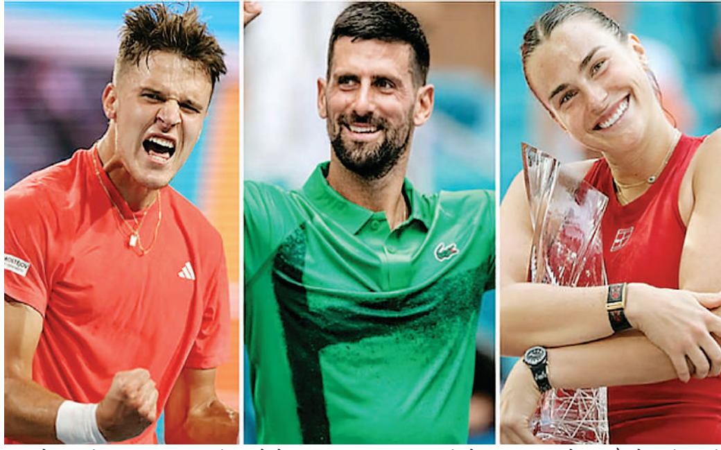
ताबड़तोड़ हमले किए। 37 साल के जोकोविच अगर यह फाइनल जीतते तो वह जिमी कोनर्स और रोजर फेडरर के