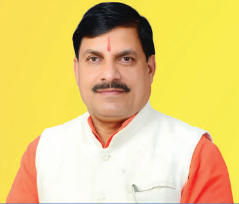
डॉ. मोहन यादव, मुख्यमंत्री