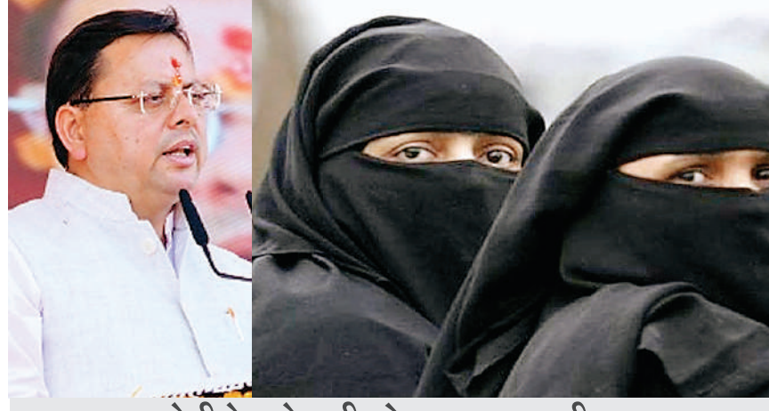
बरेली मेयर ने धामी को बताया धाकड़ सीएम

उत्तराखंड के मुख्यमंत्री पुष्कर सिंह धामी ने कहा कि यूसीसी कानून संविधान का मूल है, जिसे उत्तराखंड में लागू करके संविधान निर्माताओं को सच्ची श्रद्धाजलि अर्पित की है। समान कानून से तीन तलाक, हलाला जैसी घटनाओं पर प्रभावी अंकुश लगेगा। लिव इन रिलेशनशिप पंजीकरण से दिल्ली के श्रद्धा हत्याकांड नहीं होंगे। कानून लागू करने की वजह ये भी है कि ऐसी घटनाओं को देख नहीं सकता। उम्मीद है कि देवभूमि की नदियों की भांति ये कानून भी पूरे भारत तक पहुंचेगा। उत्तराखंड में समान नागरिक संहिता कानून लागू करने पर सीएम धामी का बरेली में स्वागत किया गया। इन्वर्टिस यूनिवर्सिटी में सोमवार का आयोजित स्वागत और अभिनन्दन समारोह में धामी ने