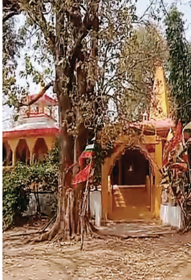
डकैतों की माता का मंदिर के रहस्य

12वीं सदी में अस्तित्व में आया ये मंदिर बुदेलखंड और वीरों की सदी यानी 12 वीं सदी में पृथ्वीराज चौहान को चौकाने वाले आल्हा ऊदल की कहानी इस मंदिर की स्थापना से जुड़ी हुई है। यहां चैत्र नवरात्र में माता की कृपा पाने लोगों का ताता लगता है। बुदेलखंड के वीर आल्हा-ऊदल ने इस मंदिर को बनवाया था। करीब साढ़े 800 साल पहले वे महोबा से माथोढ़ गए जा रहे थे। पहुंचने में देर यानि बुदेली भाषा में अंबेर हो जाने पर उन्होंने यहीं बियाबान जंगल में ही अपना डेरा डाल दिया। रात में जब उन्होंने अपनी आराध्य देवी का आह्वान किया तो मां ने उन्हें दर्शन देकर इसी स्थान पर मंदिर बनवाने की प्रेरणा दी। माता की प्रेरणा से उन्होंने यहां चट्टान पर मां की मूर्तिया बनावा कर प्रतिमा स्थापित कराईं। तभी से यहां मां को अबार माता के नाम जाना जाने लगा। चट्टान के पास गर्भगृह में विराजी अबार माता जगत जननी जगदंबा का ही रूप हैं। बाद में जब यहां गांव बसा तो लोगों ने चट्टान के पास मंदिर बनवाकर उसमें सिद्ध प्रतिमा की प्राण प्रतिष्ठा करा दी। किंवदंती है कि इस मंदिर में मौजूद एक विशालकाय चट्टान है, जिसका