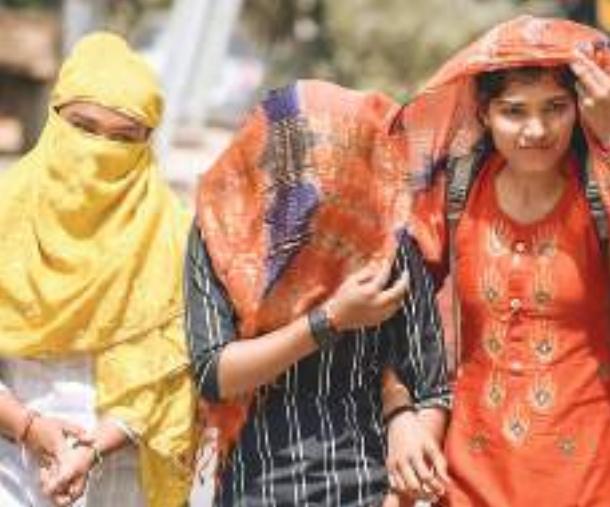
तापमान अचानक बढ़ रहा है। गर्मी की वजह से फसलों को काफी नुकसान पहुंचा है। पश्चिमी विक्षोभ छोटी-छोटी आई है। इसलिए बहुत ज्यादा गर्मी पड़ेगी। अप्रैल के दूसरे सप्ताह में लू के थोड़े

तापमान में तेजी से हो रहे बदलाव की वजह से मौसम के जानकार भी हैरान हैं। वे मौसम के बदले रुख की वजह जलवायु परिवर्तन बता रहे हैं। मौसम के जानकारों का कहना है यह तो मार्च है। अभी अप्रैल, मई, जून का महीना बाकी है। विशेषज्ञों का कहना है कि इस बार मौसम में हो रहे बदलाव को देखते हुए इसकी प्रबल संभावना है कि अप्रैल के दूसरे सप्ताह से ही लू के थोड़े चलने लगेंगे। जबकि आमतौर पर लू मई के दूसरे सप्ताह से चलते हैं।