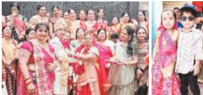
सत्ता सुधार ■ खरगोन भावसार समाज की कुलदेवी मां हिमालाज

प्राकटत्सव एवं गणगौर उत्सव के उपलक्ष्य में आयोजित कार्यक्रमों के दौरान फूल