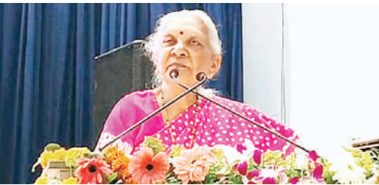
सभी विश्वविद्यालय गांवों को गोद लेकर बच्चों के विकास में योगदान कर रहे हैं। अब नशे के खिलाफ अभियान खड़े जाने की जरूरत है। इसमें छात्र-छात्राएं अपना योगदान सुनिश्चित करें। इसके लिए समाज को जागरूक करें। गांव-गांव जाकर लोगों को जागरूक करें। बहू को बेटी की तरह

यूपी के अयोध्या में शुक्रवार को राज्यपाल आनंदीबेन पटेल ने डॉ. राम मनोहर लोहिया अवध विश्वविद्यालय में आयोजित आंगनवाड़ी केंद्रों को प्री स्कूल किट वितरित कार्यक्रम में हिस्सा लिया। इस मौके पर उन्होंने कहा कि समाज से ऊंच-नीच का भेदभाव और जातिवाद का जहर खत्म करना होगा। इसकी शुरुआत हमें बच्चों से करनी होगी। उन्होंने कहा कि प्रदेश के