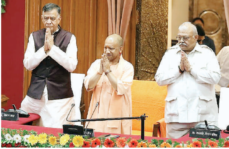
का विजन डॉक्यूमेंट रखा। इसमें विकसित भारत की परिकल्पना साकार की गई। प्रधानमंत्री ने पंच प्रण की शपथ ली। वही पंच प्रण विकास का आधार बनेंगे। नेतृत्व का गुण विकसित करने के लिए आचार-विचार बेहद जरूरी है। आचरण बेहद जरूरी है।

पंच प्रण विकास का आधार बनेंगे- सीएम ने कहा कि ट्रेड चला कि हमारी मांगे पूरी हों... चाहे जो मजबूरी हो। इस वजह से तमाम समृद्ध शहर प्रभावित हुए। प्रधानमंत्री ने 25 वर्ष