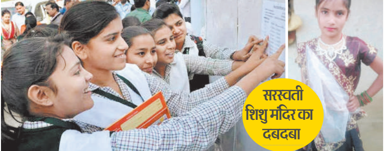
सरस्वती शिशु मंदिर का दबदबा

ऐसा रहा रिजल्ट 86.22 फीसदी सरकारी स्कूल 90.60 फीसदी प्रायवेट स्कूल 67.40 फीसदी मदरसा का रिजल्ट