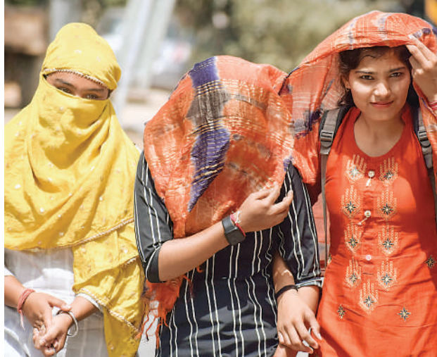
तापमान अचानक बढ़ रहा है। गर्मी की वजह से फसलों को काफी नुकसान पहुंचा है। पश्चिमी विक्षोभ छोटी-छोटी आई है। इसलिए बहुत ज्यादा गर्मी पड़ेगी। अप्रैल के दूसरे सप्ताह में लू के थपड़े

चिलचिलाती धूप ने जनजीवन को प्रभावित करना शुरू कर दिया है। रोजाना गर्मी का पारा चढ़ रहा है। मार्च में ही गर्मी ने अपने सखा तैवर दिखाने शुरू कर दिए हैं। अलीगढ़ में गर्मी ने पिछले 10 साल का रिकॉर्ड तोड़ दिया है। दोपहर में अधिकतम 39 डिग्री सेल्सियस रहा है, जो पिछले 10 साल से ज्यादा है। तापमान में तेजी से हो रहे बदलाव की वजह से मौसम के जानकार भी हैरान हैं। वे मौसम के बदले रुख की वजह जलवायु परिवर्तन बता रहे हैं। मौसम के जानकारों का कहना है यह तो मार्च है। अभी अप्रैल, मई, जून का महीना बाकी है। विशेषज्ञों का कहना है कि इस बार मौसम में हो रहे बदलाव को देखते हुए इसकी प्रबल संभावना है कि अप्रैल के दूसरे सप्ताह से ही लू के थपड़े चलने लगेंगे। जबकि आमतौर पर लू मई के दूसरे सप्ताह से चलते हैं।