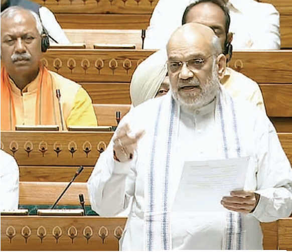
बंगाल में ममता सरकार की सह पर घुसपैठ

बीजा की अवधि खत्म होने पर भी देश में रहने वालों को ट्रेक किया जाएगा। शाह ने विपक्ष को आड़े हाथों लिया और कहा कि जिस तरह के सवाल पूछे गए हैं, उनसे काफी हैरानी होती है। उन्होंने कहा कि देश की जनता ने भाजपा को वोट दिया। हमने बहुमत की सरकार बनाई है। ऐसे में सरकार के पास विदेशी लोगों की घुसपैठ, भारत आने वाले लोगों के पास वैध कगजात हैं या नहीं, इसकी जांच करने का पूरा अधिकार है। इधर, शाह के जवाब के बाद गुरुवार शाम करीब 6.20 बजे लोकसभा स्पीकर ओम बिरला ने विधेयक पारित होने का एलान किया।