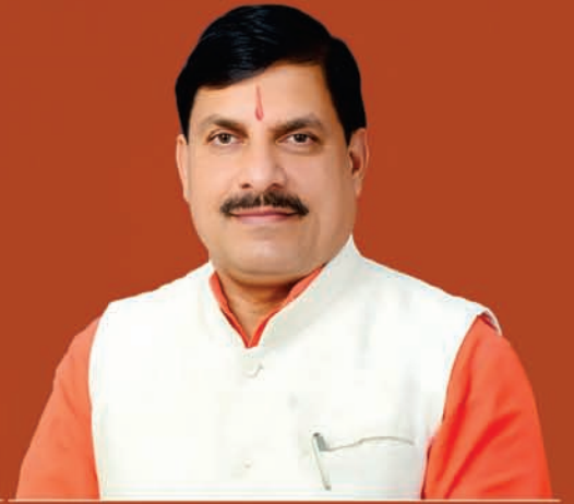
डॉ. मोहन यादव, मुख्यमंत्री