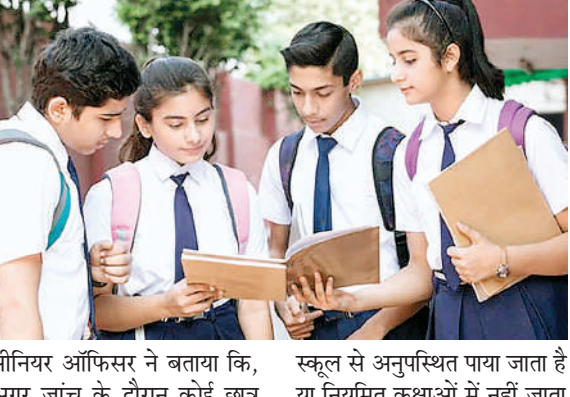
सीनियर ऑफिसर ने बताया कि, अगर जांच के दौरान कोई छात्र स्कूल से अनुपस्थित पाया जाता है या नियमित कक्षाओं में नहीं जाता

छात्रों को कक्षा 12वीं बोर्ड परीक्षा देने से रोका जाएगा। अधिकारी ने बताया कि डमी स्कूलों में दाखिला लेने की जिम्मेदारी छात्रों और उनके माता-पिता की होगी। दरअसल, सीबीएसई अपनी परीक्षा नियमावली में संशोधन करने पर विचार कर रहा है। नए नियमों के अनुसार, डमी स्कूलों के छात्रों को बोर्ड परीक्षा में बैठने की अनुमति नहीं होगी। ऐसे छात्रों को राष्ट्रीय मुक्त विद्यालयी शिक्षा संस्थान की परीक्षा देनी होगी। सीबीएसई के एक