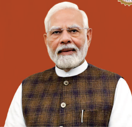
नरेन्द्र मोदी, प्रधानमंत्री