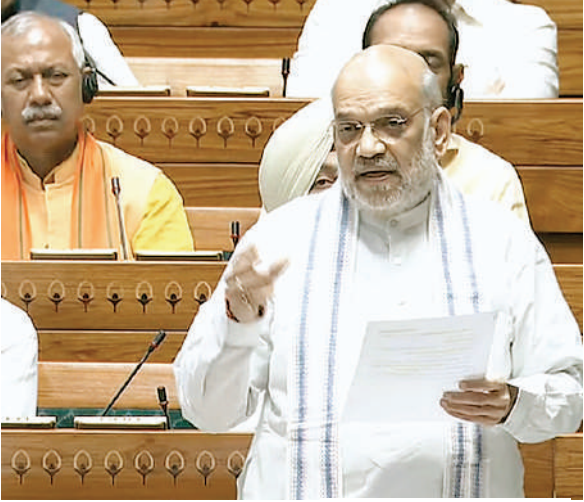
बंगाल में ममता सरकार की सह पर घुसपैठ

बीजा की अवधि खत्म होने पर भी देश में रहने वालों को ट्रैक किया जाएगा। शाह ने विपक्ष को आड़े हाथों लिया और कहा कि जिस तरह के सवाल पूछे गए हैं, उनसे काफी हैरानी होती है। उन्होंने कहा कि देश की जनता ने भाजपा को वोट दिया। हमने बहुमत की सरकार बनाई है। ऐसे में सरकार के पास विदेशी लोगों की घुसपैठ, भारत आने वाले लोगों के पास वैध कागजात हैं या नहीं, इसकी जांच करने का पूरा अधिकार है। इधर, शाह के जवाब के बाद गुरुवार शाम करीब 6.20 बजे लोकसभा स्पीकर ओम बिरला ने विधेयक पारित होने का एलान किया।