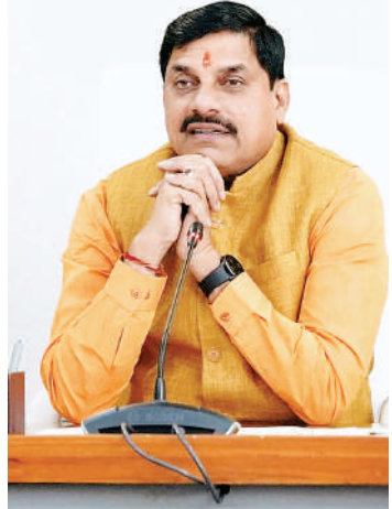
समेलन और 40वें मध्यप्रदेश युवा वैज्ञानिक सम्मेलन के उद्घाटन के दौरान वर्चुअल रूप से कही। सम्मेलन में विज्ञान और प्रौद्योगिकी के विभिन्न पहलुओं पर चर्चा हुई। सीएम ने मेक इन इंडिया और आत्मनिर्भर भारत की नीति को भारत के इस क्षेत्र में सफलता का कारण बताया। उन्होंने कहा कि मध्यप्रदेश भी इस क्षेत्र में नए अवसरों की ओर अग्रसर है।