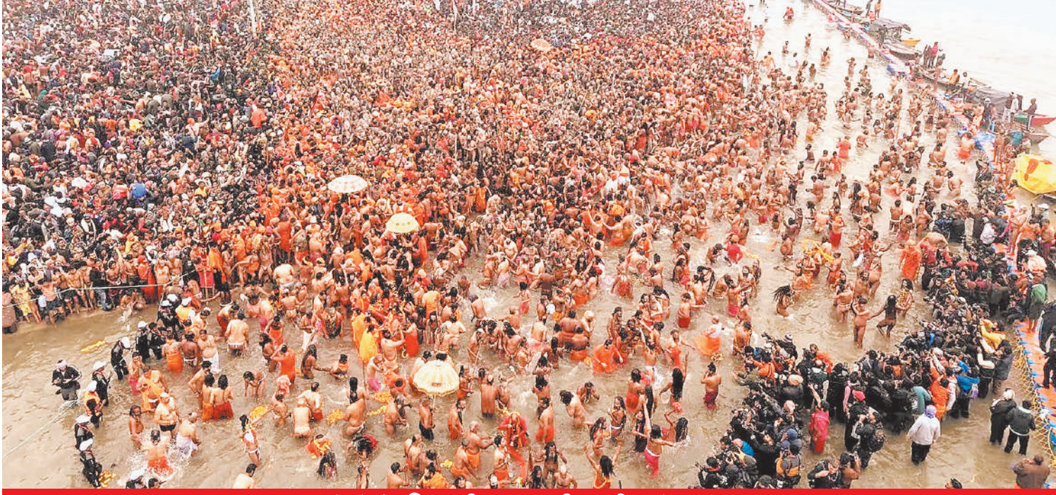
आम लोगों के लिए भी स्नान की कई घाटों पर व्यवस्था