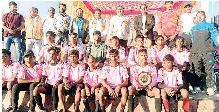
शहडोल की टीम विजेता तथा बी पी ई एस शहडोल की टीम उप विजेता रही। इसी तरह वालीवाल पुरुष का

फुटबाल प्रतियोगिता में फाइनल शहडोल एवं विचारपुर की टीम के बीच खेला गया, जिसमें शहडोल की टीम विजेता तथा युवा मंडल विचारपुर की टीम उपविजेता रही। कबड्डी महिला प्रतियोगिता का फाइनल जोजो एकेडमी शहडोल एवं बी पी ई एस शहडोल के बीच खेला गया जिसमें जोजो एकेडमी