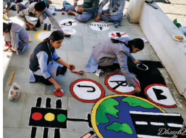
लेखन, चित्रकला और रंगोली प्रतियोगिताएँ आयोजित की गईं, जिसमें करीब 80 छात्रों ने भाग लिया। प्रतियोगिता के विजेताओं को थाना परिसर

इसके साथ, शहर के विभिन्न स्कूलों के छात्रों के बीच यातायात जागरूकता से संबंधित निबन्ध