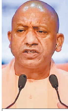
अखाड़ों में नहीं होगा अमृत स्नान

महाकुंभ में पवित्र डुबकी की आस लिए महाकुंभ नगर पहुंचे श्रद्धालुओं की बढ़ती भीड़ को देखते हुए मुख्यमंत्री योगी आदित्यनाथ सहित प्रमुख संतों ने लोगों से खवास अपील की है। योगी ने कहा कि श्रद्धालुगण मां गंगा के जिस भी घाट के समीप हैं, वहीं स्नान करें, संगम नोज की ओर जाने का प्रयास न करें। स्नानार्थियों के लिए कई घाट बनाए गए हैं, जहां सुविधाजनक रूप से स्नान किया जा सकता है। महाकुंभ में हुई भगदड़ के बाद मुख्यमंत्री योगी ने श्रद्धालुओं से अपील की है कि वह संगम नोज जाने के बजाय निकट के घाट पर स्नान कर लें। सीएम योगी ने कहा है कि स्नान के लिए कई घाट बनाए गए हैं। लोग वहां स्नान कर सकते हैं। उन्होंने कहा कि इस मामले में प्रशासन के नियमों का ध्यान रखें और किसी प्रकार की अफवाह में न आए।