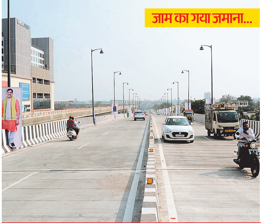
जाम का गया जमाना...