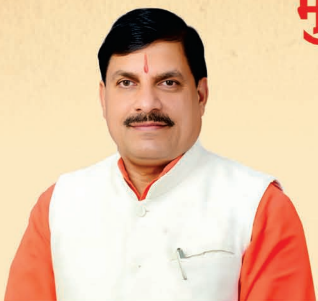
डॉ. मोहन यादव, मुख्यमंत्री