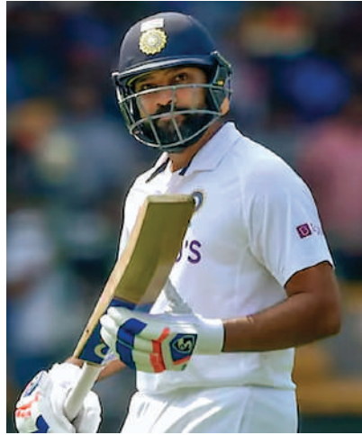
लाल गेंद से अधिक स्विंग करती है। ऐसे में तेज

पूर्व क्रिकेटर संजय मांजरेकर सहित कई खिलाड़ियों का मानना है कि कप्तान रोहित शर्मा को एडीलेड टेस्ट में पारी की शुरुआत नहीं करनी चाहिये। मांजरेकर के अनुसार गुलाबी गेंद से खेले जाने वाले दिन-रात के इस टेस्ट में रोहित अगर अपने बल्लेबाजी क्रम को बदलकर किसी अन्य क्रम पर उतरें तो वे उनके और टीम के लिए फायदेमंद रहेगा। इसके अन्य कारण भी हैं। उन्होंने कहा कि रोहित पिछले काफी समय से फॉर्म में नहीं हैं। उन्होंने न्यूजीलैंड के खिलाफ पिछली घरेलू सीरीज में 3 मैच की 6 पारियों में केवल 91 रन बनाए थे। इसके बाद ऑस्ट्रेलिया आकर भी वह प्रधानमंत्री एकादश के खिलाफ अभ्यास मैच में केवल 3 रन ही बना पाये। वहीं दूसरा टेस्ट दिन का होने के कारण इसमें गुलाबी गेंद इस्तेमाल होती है। वे गेंद आमतौर पर