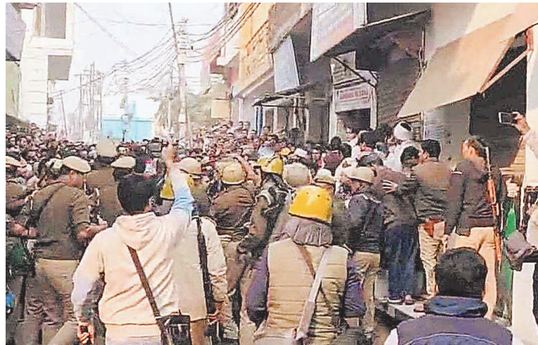
संभल में हालात काबू करने को सड़क पर उतरे एसपी, सड़क पर बेहिसाब पत्थर और कारतूस के दिखे खोखे, टूटे सीसीटीवी-पथराव दे रहा मंजर की गवाही