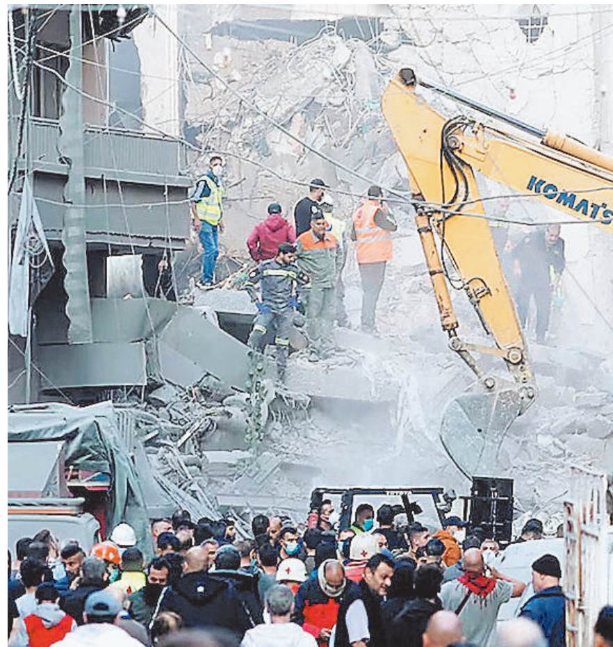
लेबनान में इजरायली हमले के बाद राहतकर्मी इलाके से मलबा हटकर इलाके को साफ करते हुए।

बताया जा रहा है कि बीती रात ही 20 लोगों की मौत हो गई है। आलम यह है कि शिया मुस्लिमों ने पाकिस्तान के एक विशाल झंडे को भी उतारकर उसकी जगह पर अपना झंडा लहरा दिया। इस सांप्रदायिक हिंसा को देखते हुए पूरे इलाके में कर्फ्यू लगा दिया गया है। कुर्रम के डेयूटी कमिश्नर ने मरने वालों के आकड़े की पुष्टि की है। इस हिंसा के बाद पूरे इलाके में भारी विरोध प्रदर्शन चल रहा है।