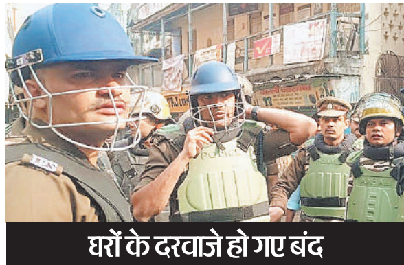
घरों के दरवाजे हो गए बंद