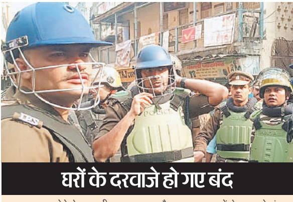
घरों के दरवाजे हो गए बंद

सीसीटीवी कैमरे भी तोड़ दिए। इस बीच हालात पर काबू पाने के लिए एसपी संभल, कृष्ण बिश्नोई सड़क पर उतर आए। एक वीडियो में वह भीड़ में शामिल उपद्रवियों को समझाते हुए नजर आए। वह उनसे कह रहे हैं कि बेटा आपका भविष्य बहुत अच्छा है, नेताओं के चक्कर में अपना भविष्य बर्बाद मत करो। वीडियो में दिख रहा है कि एसपी उपद्रवियों को समझा रहे हैं और पास में सड़क पर कई हजार ईट-पत्थर पड़े हैं। उसी से उठकर भीड़ ईट फेंकती रही। बाद में कसान खुद भीड़ की तरफ बढ़े। वहीं पथराव के दौरान पुलिस समझाती रही, लेकिन पत्थरबाज नहीं माने। सीएम योगी ने पत्थरबाजी करने वालों पर कड़ा एक्शन लेने के निर्देश दिए हैं। वहीं डीजीपी ने कहा- पत्थर बाजी करने वालों की पहचान जा रही है। उनके खिलाफ कड़ी कार्रवाई होगी।