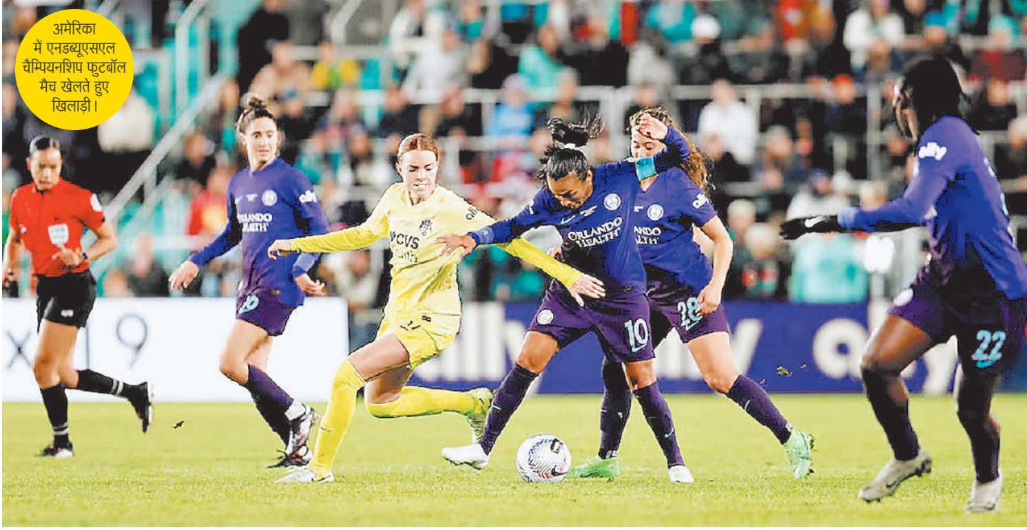
अमेरिका में एनडब्ल्यूएसएल वेमिनशिप फुटबॉल मैच खेलते हुए खिलाड़ी।

रहने का भी आग्रह किया, उन्होंने अपने इंस्टाग्राम पोस्ट के कैप्शन में लिखा, इंटरनेट पर जो कुछ भी आप देखते हैं उस पर कभी भी यकीन मत करो हमेशा सत्यापित करो। यह विवाद पर्थ स्टेडियम में पहले बॉर्डर-गावस्कर ट्रॉफी टेस्ट के दौरान पैदा हुआ, जहाँ भारत ने स्टैंड-इन कप्तान जसप्रीत बुमराह के नेतृत्व में शानदार प्रदर्शन किया। बुमराह के 5-30 के शानदार प्रदर्शन की बदौलत पहले टेस्ट में भारत ने ऑस्ट्रेलिया को 104 रनों पर समेटने के बाद चायकाल तक बिना कोई विकेट खोये 84 रन बना लिए।