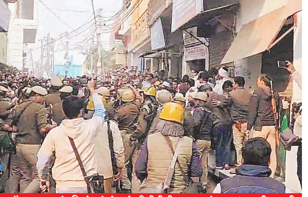
संभल में हालात काबू करने को सड़क पर उतरे एसपी, सड़क पर बेहिसाब पत्थर और कारतूस के दिखे खोखे, टूटे सीसीटीवी-पथराव दे रहा मंजर की गवाही