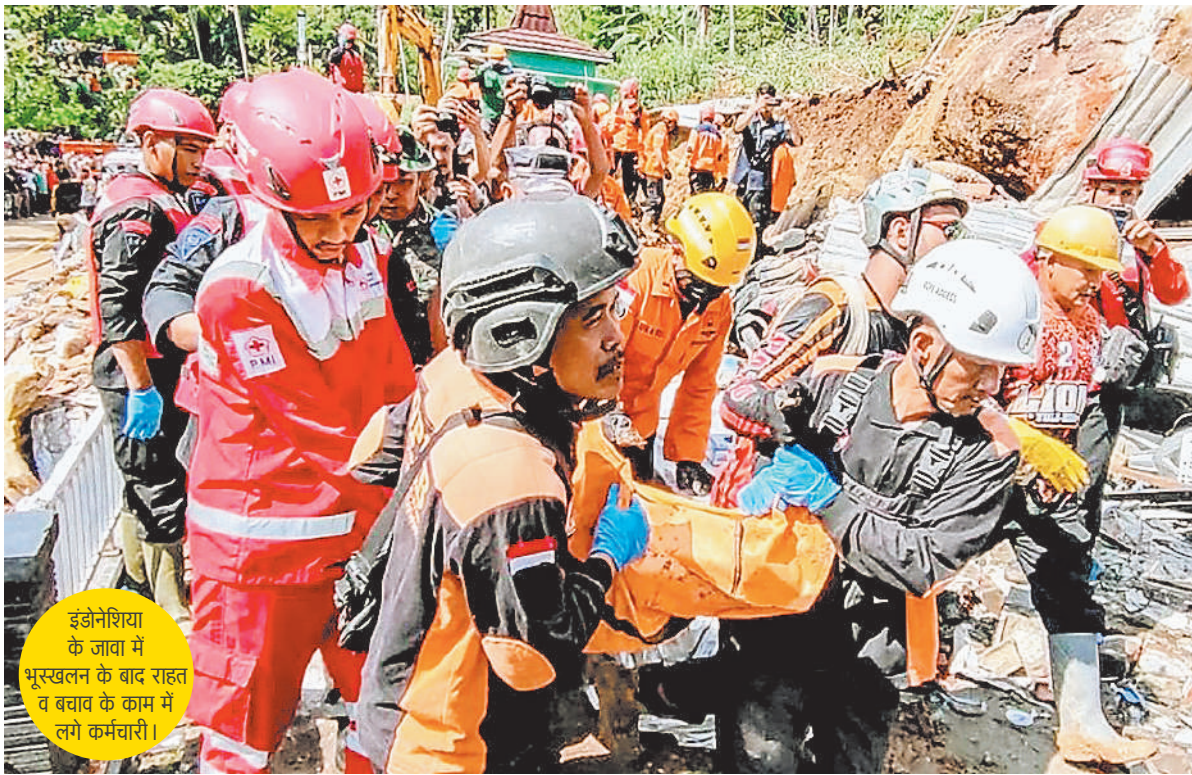
इंडोनेशिया के जावा में भूस्खलन के बाद राहत व बचाव के काम में लगे कर्मचारी।