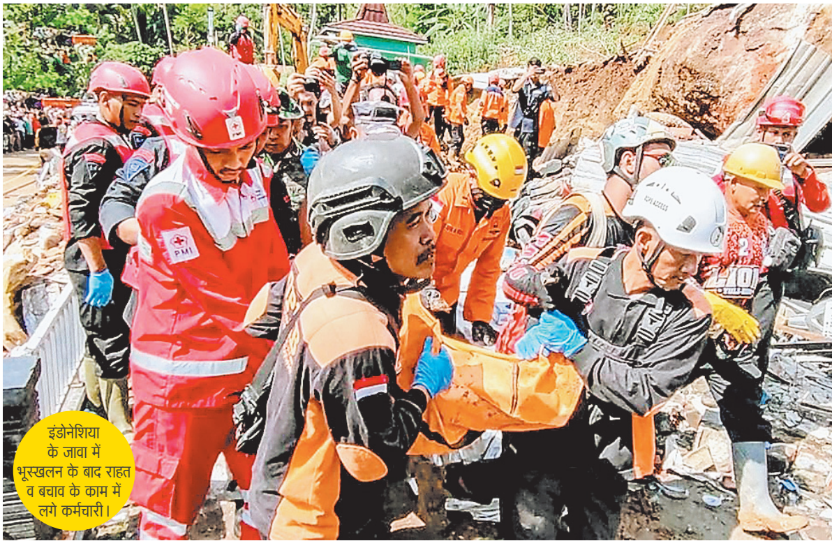
इंडोनेशिया के जावा में भूस्खलन के बाद राहत व बचाव के काम में लगे कर्मचारी।