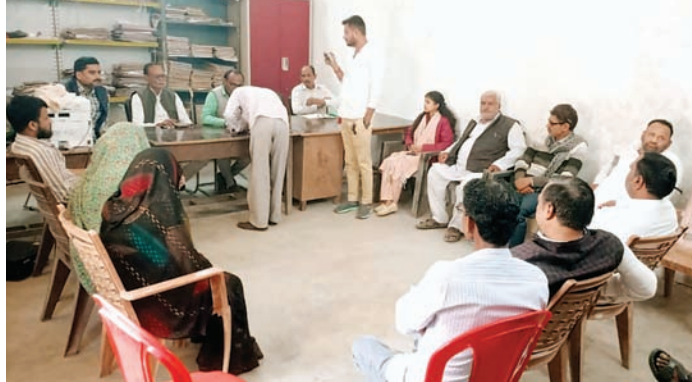
आरोप लगाया था कि संचालक मंडल का बहुमत मेरे साथ है। जिस पर अपर जिला