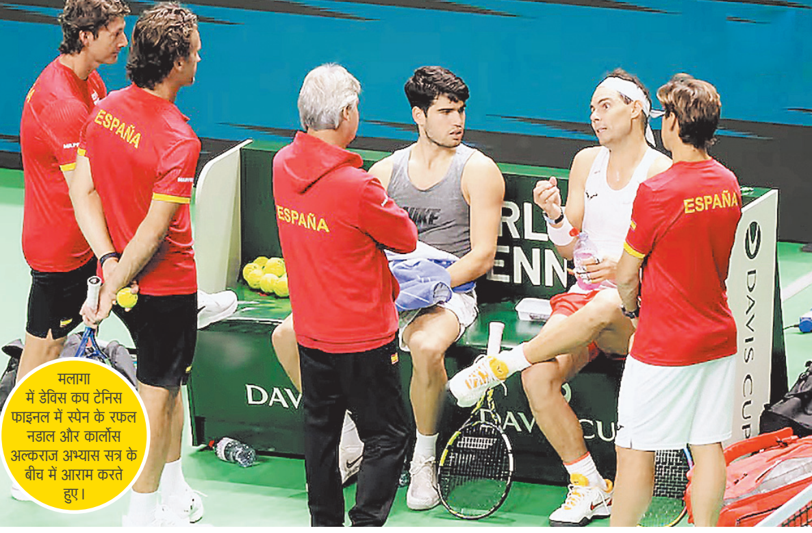
मलागा में डेविड कप टेनिस फाइनल में स्पेन के रफल नडाल और कार्लोस अल्काराज अभ्यास सत्र के बीच में आराम करते हुए।

शमी को बंगाल टी20 टीम में शामिल करने का कारण उनकी फिटनेस को देखना है जिससे कि जरूरत पड़ने पर उन्हें बॉर्डर