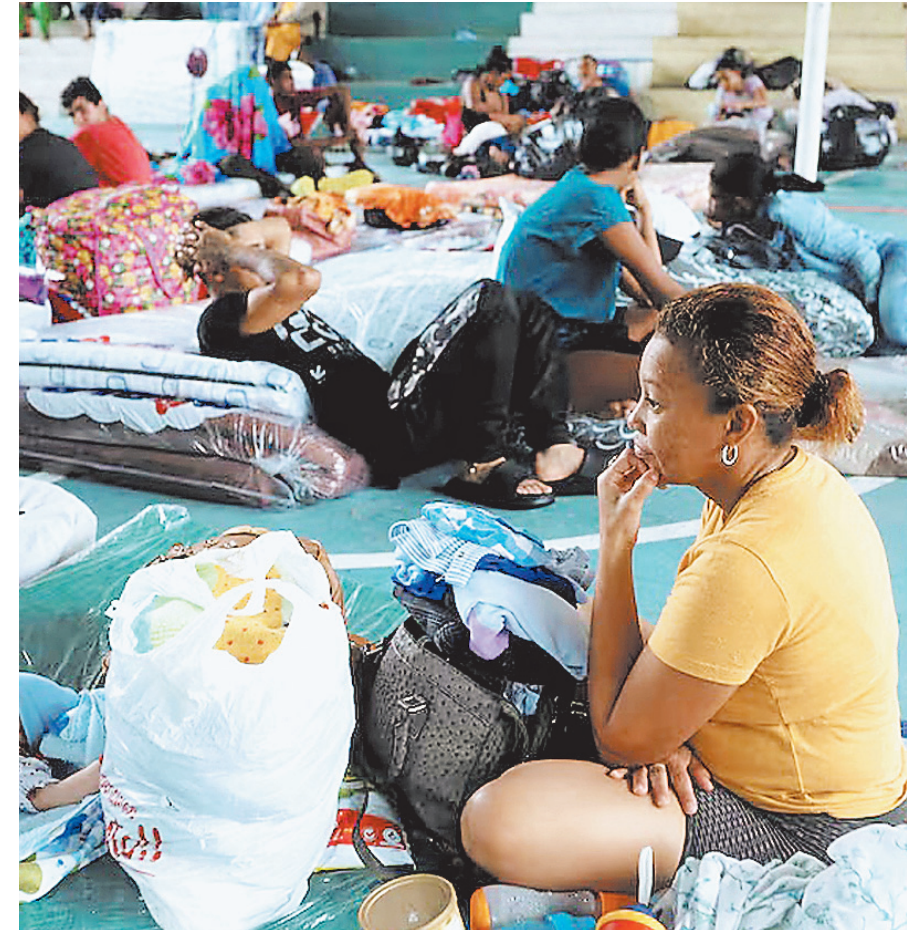
होंडुरास में तूफान सारा के आने से बेघर हुए लोग एक शेल्टर होम में आराम करते हुए।

वॉशिंगटन। नवनिर्वाचित अमेरिकी राष्ट्रपति डोनाल्ड ट्रंप की कैबिनेट को लेकर विवाद बढ़ने लगा है। वजह ये है कि कोई नाबालिग के यौन शोषण में फंसा हुआ है तो कोई ड्रग के कारोबार से जुड़ा रहा है। ऐसे में ट्रंप के कैबिनेट पर विरोधी लगातार सवाल उठा रहे हैं। ट्रंप के नामित उम्मीदवार मैट गेट्ज, जिन्हें अटॉर्नी जनरल बनाया जा रहा है, यौन दुराचार और ड्रग के इस्तेमाल के आरोपों के चलते चर्चा में हैं। गेट्ज के खिलाफ नाबालिग लड़की के साथ संबंध बनाने का गंभीर आरोप है, जिसे वह खारिज कर चुके हैं इसके अलावा, उनकी प्रशासनिक योग्यता और अनुभव पर भी सवाल उठ रहे हैं। रिपब्लिकन पार्टी के कई वरिष्ठ नेताओं और सीनेटर्स ने गेट्ज की नियुक्ति पर नाराजगी जाहिर की है। सीनेट में उनकी नियुक्ति को मंजूरी देने के लिए 51 वोटों की आवश्यकता है, लेकिन पार्टी के भीतर से ही विरोध बढ़ता जा रहा है।