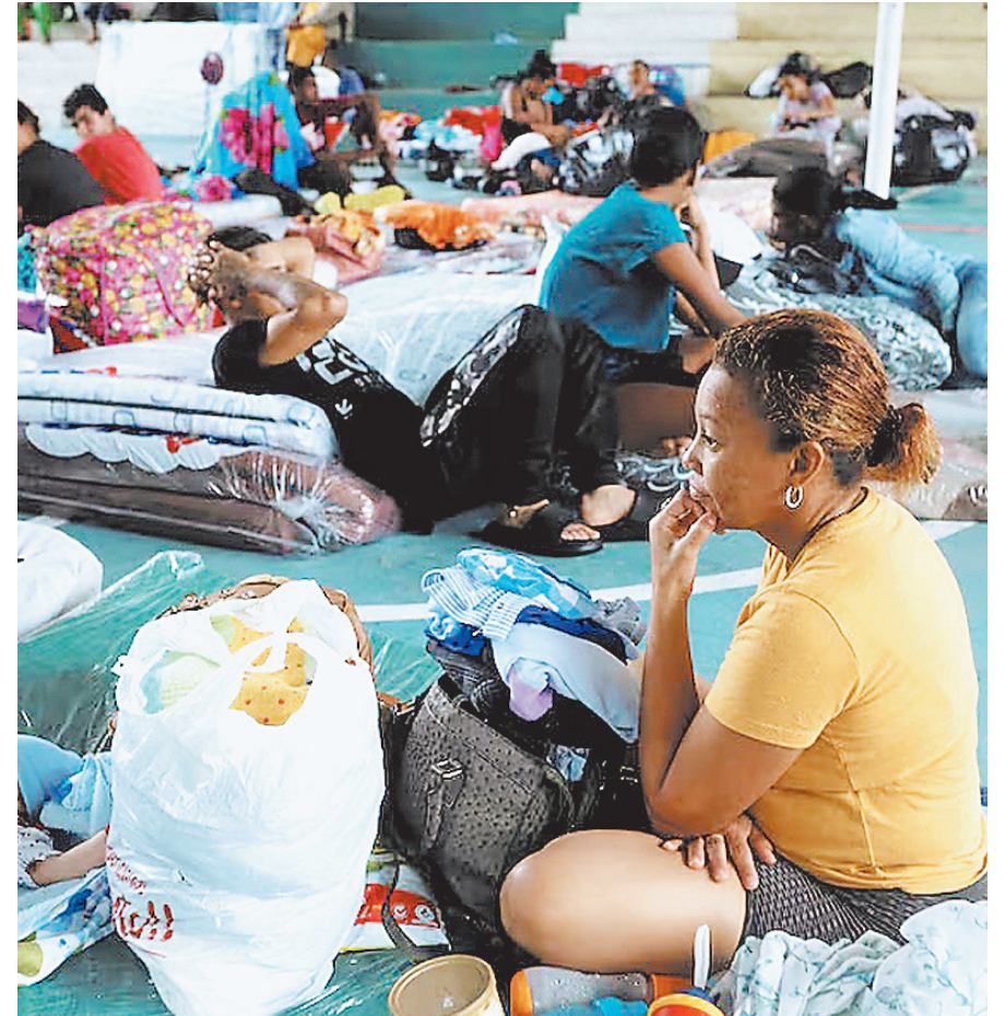
होंडुरास में तूफान सारा के आने से बेघर हुए लोग एक शेल्टर होम में आराम करते हुए।

वॉशिंगटन। नवनिर्वाचित अमेरिकी राष्ट्रपति डोनाल्ड ट्रंप की कैबिनेट को लेकर विवाद बढ़ने लगा है। वजह ये है कि कोई नाबालिग के यौन शोषण में फंसा हुआ है तो कोई ड्रग के कारोबार से जुड़ा रहा है। ऐसे में ट्रंप के कैबिनेट पर विरोधी लगातार सवाल उठा रहे हैं। ट्रंप के नामित उम्मीदवार मैट गेट्ज, जिन्हें अटॉर्नी जनरल बनाया जा रहा है, यौन दुराचार और ड्रग के इस्तेमाल के आरोपों के चलते चर्चा में हैं। गेट्ज के खिलाफ नाबालिग लड़की के साथ संबंध बनाने का गंभीर आरोप है, जिसे वह खारिज कर चुके हैं। इसके अलावा, उनकी प्रशासनिक योग्यता और अनुभव पर भी सवाल उठ रहे हैं। रिपब्लिकन पार्टी के कई वरिष्ठ नेताओं और सीनेटरों ने गेट्ज की नियुक्ति पर नाराजगी जाहिर की है। सीनेट में उनकी नियुक्ति को मंजूरी देने के लिए 51 वोटों की आवश्यकता है, लेकिन पार्टी के भीतर से ही विरोध बढ़ता जा रहा है।