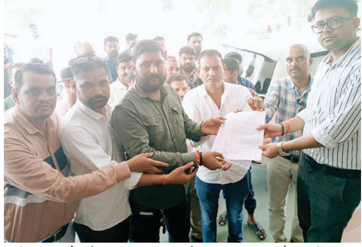
ट्राली कृषि उपयोग के लिए शासन द्वारा अधिकृत है और किसी भी प्रकार का कोई टेक्स नहीं लगता है ट्रेक्टर ट्राली कर्माध्यक्ष विभाग सहित अन्य विभागों को देने होते हैं।

रेत कारोबारियों ने कहा कि पिछले कई समय से ट्रेक्टर ट्राली द्वारा नर्मदा नदी से रेत का परिवहन किया जा रहा है। जबकि ट्रेक्टर