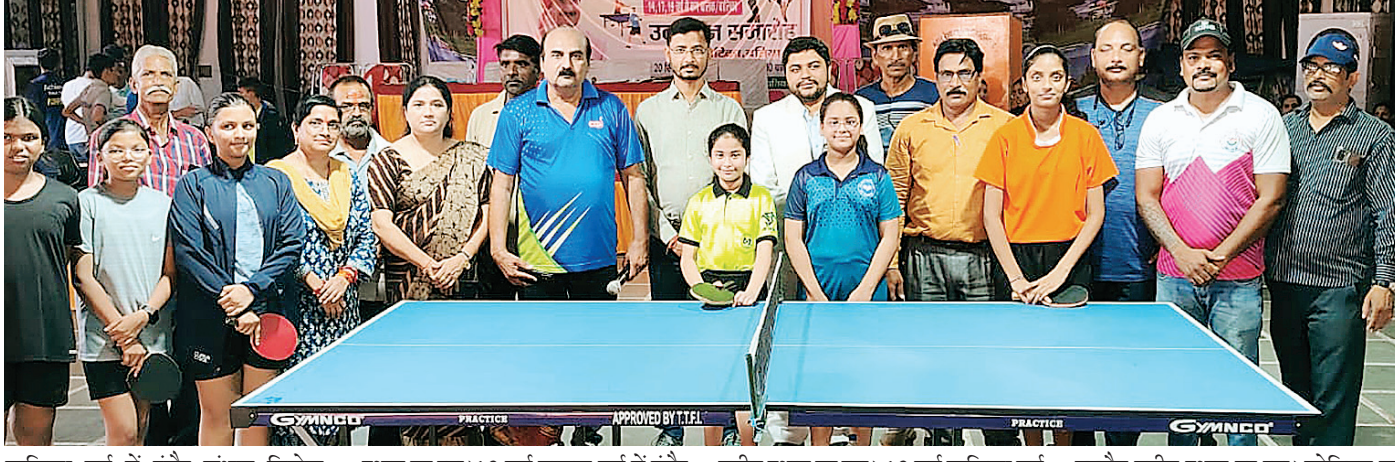
बालिका वर्ग में इंदौर संभाग विजेता, उज्जैन उपविजेता तथा जबलपुर तृतीय स्थान पर रहा। 19 वर्ष बालक वर्ग में इंदौर विजेता, उज्जैन उपविजेता तथा जबलपुर तृतीय स्थान पर रहा। 19 वर्ष बालिका वर्ग में इंदौर विजेता, उज्जैन उपविजेता तथा जबलपुर तृतीय स्थान पर रहा। स्टेडियम पर चल रहे थांगटा के मुकाबलों में ग्वालियर

स्कूल शिक्षा विभाग दतिया के तत्वाधान में 20 सितंबर से चल रही 68 वीं शालेय राज्य स्तरीय थांगटा एवम टेबल टेनिस प्रतियोगिता में एकल और टीम वर्गों में खिलाड़ियों ने अपने जोरदार खेल से सबको मंत्रमुग्ध कर दिया। गहोई वाटिका में जारी टेबल टेनिस के मुकाबलों में आज 14 वर्ष बालक वर्ग में इंदौर विजेता, भोपाल उपविजेता तथा ग्वालियर संभाग तृतीय स्थान पर रहा। बालिका 14 वर्ष वर्ग में इंदौर संभाग विजेता, जबलपुर उपविजेता तथा सागर संभाग तृतीय स्थान पर रहा। 17 वर्ष बालक वर्ग में इंदौर विजेता, भोपाल उपविजेता तथा उज्जैन तृतीय स्थान पर रहा। 17 वर्ष