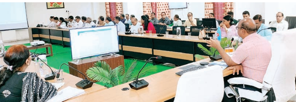
सत्ता सुधार ■ गुना

आयुष्मान पखवाड़ा का आयोजन होगा 30 सितंबर तक : शासन के निर्देश अनुसार दिनांक 20 सितंबर से 30 सितंबर तक ‘आयुष्मान पखवाड़ा’ का आयोजन किया जा रहा है, जिसकी थीम आयुष्मान आपके द्वार रखी गयी है। अलग-अलग दिवस में कार्यक्रम का आयोजन किया जाना है। इस संबंध में सीएमएचओ को निर्देशित किया गया कि अपने विभाग की