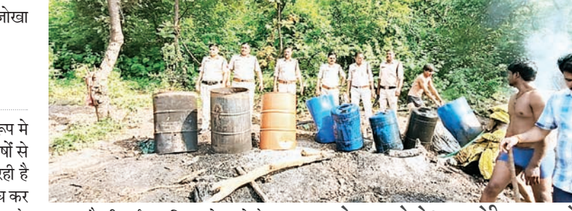
कहना है की कई बार शिकायत करने के बावजूद संबंधित विभाग और प्रशासन कोई कार्रवाई नहीं करता है जिसके चलते शराब माफिया के हाँसले चलेंद हैं। यहां सायंकाल में महिलाएं घरों से निकलने में भी डर महसूस करती हैं क्योंकि कई बार शराबी यहां से निकल कर सड़क पर खड़े रहते हैं और निकलने पर भदे कॉमेंट्स करते हैं।

खंडवा शहर के सबसे पाँश इलाके के रूप में जाने जाने वाले आनंद नगर एरिया में जहां वर्षों से रहवासी क्षेत्र में शराब दुकान संचालित हो रही है जिसका क्षेत्रवासी कई वर्षों से लगातार विरोध कर रहे हैं वहीं पिछले कई महीनों से यह शराब दुकान के साइड से रास्ता बना कर पीछे खुले आम अवैध दुकानों पर भी शराब माफिया द्वारा देशी विदेशी मदिरा खुले आम बिकवाई जा रही है। सबसे बड़ा सवाल तो यह है कि जिला मुख्यालय पर शहर के सबसे संप्रभत कहे जाने वाले क्षेत्र में यह सब गौरख धंधा किसके संरक्षण में चलाया जा रहा है। यहां के रहवासियों