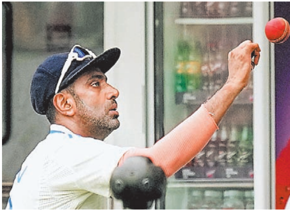
अश्विन ने कहा, मेरे लिए टीम में अपने को साबित करना बहुत बड़ी चुनौती थी। मैं जूनियर आयु वर्ग में

भारतीय क्रिकेट टीम के अनुभवी स्पिनर रविचंद्रन अश्विन ने कहा है कि जब वह शुरुआत में भारतीय टीम में आये थे तो दिग्गज ऑफ स्पिनर हरभजन सिंह की नकल करते थे। इस कारण ये था कि वह हरभजन से प्रेरित थे और उन्हीं की तरह गेंदबाजी करना चाहते थे। इसके लिए वह हरभजन के गेंदबाजी एक्शन की नकल भी करते थे। उन्होंने कहा कि जब वह हरभजन की जगह पर भारतीय टेस्ट टीम में लिए गये तो लोगों को लगा कि वह किस प्रकार उनकी जगह ले पायेगे।