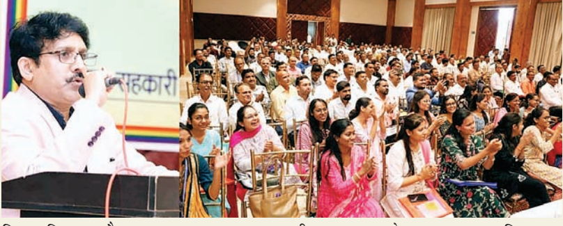
वितरण किया गया है। बैंक प्रशासक एवं संयुक्त आयुक्त सहकारिता

से राशि 2944.17 करोड़ लाख का ऋण कृषक सदस्यों को शुभ्य प्रतिपत् ब्याज दर पर उपलब्ध कराया है साथ ही खरगोन बडवानी जिले के अमानतदारों का विश्वास जिला सहकारी बैंक के प्रति है जिसके फलस्वरूप बैंक की अमानत राशि. 2256.06 करोड़ है। बैंक द्वारा सदस्यों को पशुपालन कार्यशील पूंजी ऋण भी उपलब्ध कराया जा रहा है। बैंक द्वारा 31.03.2024 पर रुपए. 250.83 लाख का शुद्ध लाभ अर्जित किया है। उल्लेखनीय है कि बैंक स्थापना वर्ष से ही निरंतर सदस्य संस्थाओं को लाभार्थ वितरण कर रही है। इस वर्ष भी 62.70 लाख का लाभार्थ