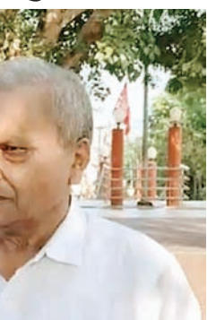
सत्ता सुधार ■ गुना

हमारी भी प्राथमिकता है कि एक अखंड भंडारा चलता रहे। जिसमें बाहर से आने वाले श्रद्धालुओं एवं साधु-संतों को भोजन की व्यवस्था की जाए। हमारे पास अभी संतों एवं श्रद्धालुओं को उठरने की व्यवस्था है। बसें की बसें यहां आती है यहां ट्रस्ट द्वारा उन्हें उठरने की समुचित व्यवस्था की जाती है तो रात को रूककर सुबह दर्शन कर अपने गंतव्य की ओर