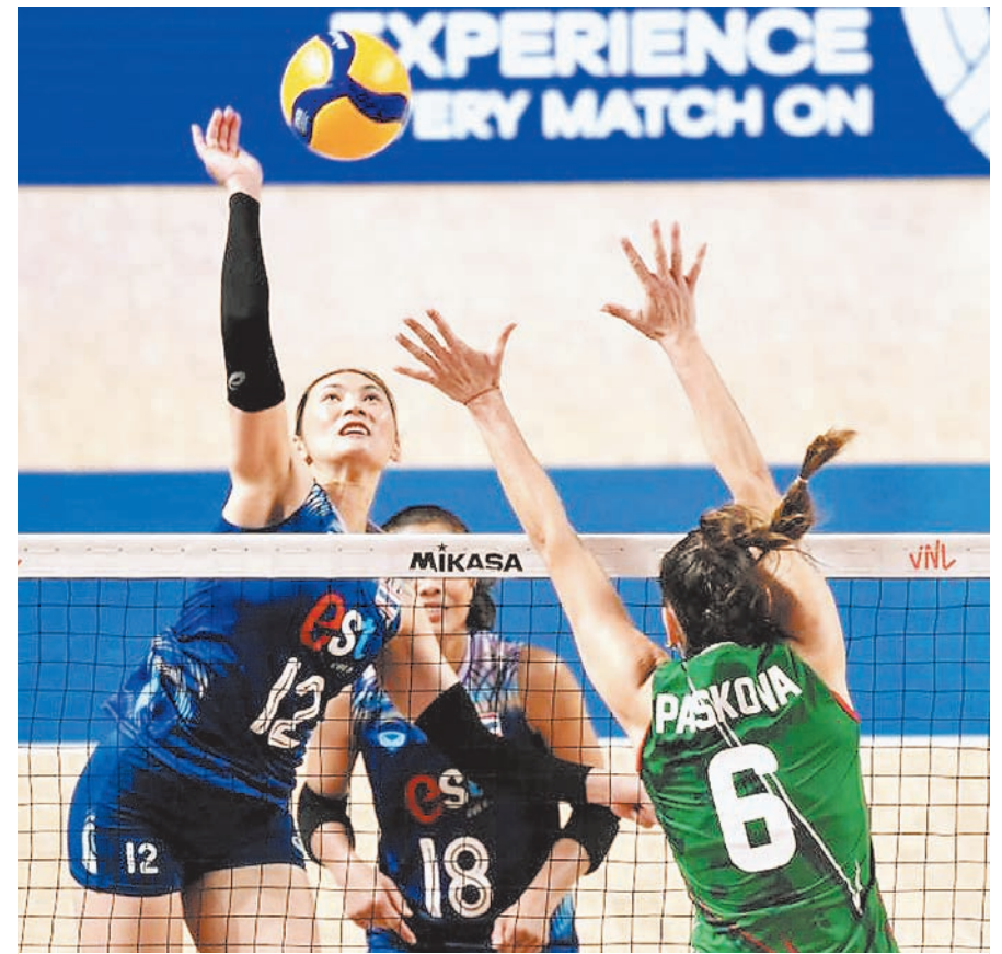
हांगकांग में महिला वालीबाल नेशनल लीग में खेलती हुई खिलाड़ी।