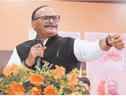
संयुक्त प्रेसवार्ता को संबोधित किया था। गुरुवार को दिल्ली के सीएम अरविंद केजरीवाल और अखिलेश यादव ने संयुक्त प्रेसवार्ता कर इंडिया गठबंधन की जीत के दावे किए।

सत्ता सुधार ■ लखनऊ उप मुख्यमंत्री ब्रजेश पाठक ने कहा कि इंडी गठबंधन लोकसभा चुनाव में पलाप साबित होगा। ये ध्रुवचरित्र में डूबे हुए लोगों का समूह है। राहुल गांधी और अखिलेश यादव को अपने ही प्रदेश में जनता ने ठुकरा दिया है। उन्होंने कांग्रेस अध्यक्ष मल्लिकार्जुन खरगे और अखिलेश यादव की संयुक्त प्रेस कॉन्फ्रेंस पर कहा कि इसका कोई मतलब नहीं है।