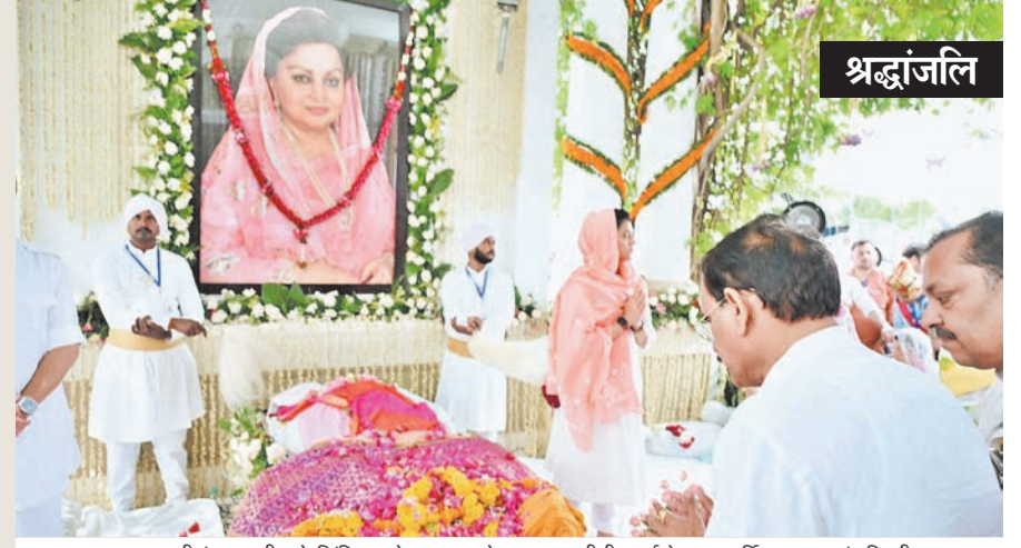
राजमाता श्रीमंत माधवीराजे सिधिया को भाजपा प्रदेश अध्यक्ष वीडी शर्मा ने फूल अर्पित कर श्रद्धांजलि दी।