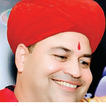
सत्ता सुधार ■ हरदा