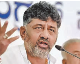
किया। उन्होंने कहा कि 10 किलो फ्री राशन, 200 यूनिट मुफ्त बिजली, महिलाओं को 2000 रुपये प्रतिमाह, महिलाओं को नि:शुल्क बस यात्रा और युवाओं को रोजगार दे रहे हैं। उन्होंने साफ़ किया कि कर्नाटक में पांच किलो राशन और पांच किलो का पैसा दे रहे हैं। अगर इंडिया गठबंधन की सरकार केंद्र में बनी तो ये सभी गारंटियां पूरे देश में लागू करेंगे। केंद्र और यूपी की सरकार बताए उन्होंने 10 साल में क्या किया? युवा बेरोजगार हैं।

सत्ता सुधार ■ लखनऊ कर्नाटक के उप मुख्यमंत्री व कर्नाटक प्रदेश कांग्रेस कमेटी के अध्यक्ष डीके शिवकुमार ने दावा किया है कि लोकसभा चुनाव में इंडिया गठबंधन 300 सीटों पर जीत हासिल करेगा। इस बार केंद्र में भाजपा की सरकार नहीं बनने वाली। इंडिया गठबंधन को बहुत मिलने पर प्रधानमंत्री कौन होगा? इस पर शिवकुमार ने कहा कि इसका निर्णय बाद में होगा। हम संयुक्त नेतृत्व में विश्वास करते हैं। वह गुरुवार को लखनऊ में मीडिया को संबोधित कर रहे थे। डीके ने कहा है कि हमने कर्नाटक में सरकार बनने से पहले जिन गारंटियों का वादा किया था सरकार में आने के बाद उसे पूरा