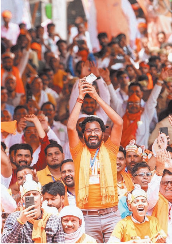
आजमगढ़ में आयोजित जनसभा को संबोधित किया। इस दौरान उन्होंने सपा-कांग्रेस के साथ इंडी गठबंधन पर जमकर निशाना साधा। साथ ही सरकार की विभिन्न योजनाओं को लेकर जनता को जानकारी भी दी। मोदी जनसभा में मौजूद लोगों को हंसाते भी रहे।

अर्थव्यवस्था पांचवें स्थान पर लाया है। पीएम ने कहा कि हमारी सरकारी तीसरी बार सत्ता में आई तो देश को विश्व की तीसरी सबसे बड़ी अर्थव्यवस्था बनाएंगे। यह मोदी की गारंटी है। सपा और कांग्रेस के लोग न मेहनत के आदी हैं न ही नजीते लागे की इनमें सामर्थ्य है। इंडिया गठबंधन ही रहा पीएम के निशाने पर सपा और कांग्रेस की तुष्टीकरण की राजनीति यहीं पर नहीं रुकी। यह लोग मोदी के खिलाफ वोट जिहाद की अपील कर रहे हैं। कांग्रेस के शहजादे कहते हैं कि वह सत्ता में आएंगे तो रामलला को फिर टेंट में भेज देंगे और राम मंदिर में ताला लगावा देंगे, लेकिन मोदी ऐसा नहीं होने देंगे। हमारे रहते ऐसा नहीं हो सकता है। 27 मिनट के भाषण में पीएम मोदी के निशाने पर सिर्फ सपा और कांग्रेस ही रही। उन्होंने एक बार भी मायावती या बसपा का नाम नहीं। पूरे भाषण में वह राहुल गांधी और अखिलेश यादव पर ही हमलावर रहे। आजमगढ़ में भी हुंकार इधर, प्रधानमंत्री ने गुरुवार को