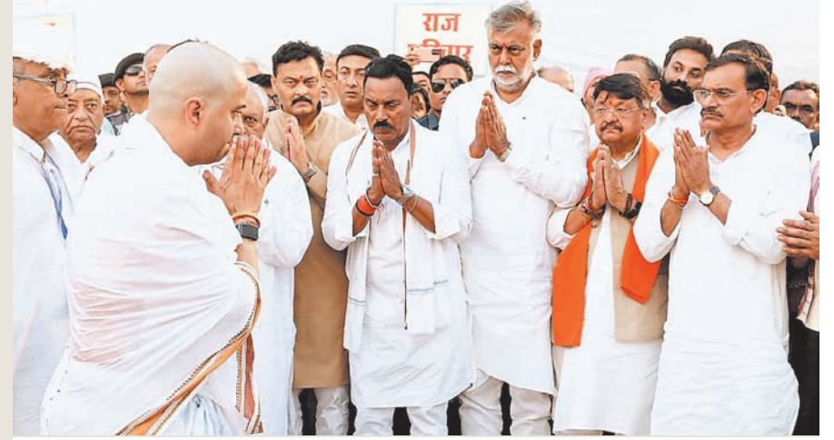
राजमाता माधवीराजे सिधिया को श्रद्धांजलि देने पहुंचे कैलाश विजयवर्गीय, प्रहलाद पटेल समेत कई मंत्रियों ने केंद्रीय मंत्री ज्योतिरादित्य सिधिया को सांत्वना दी और उनकी माताश्री के पर निधन दुख व्यक्त किया।