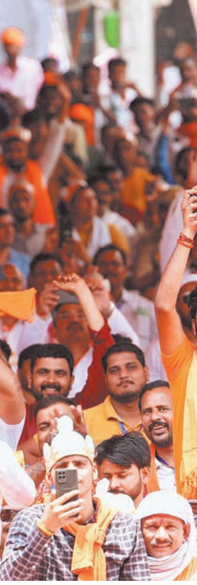
आजमगढ़ में आयोजित जनसभा को संबोधित किया। इस दौरान उन्होंने सपा-कांग्रेस के साथ इंडी गठबंधन पर जमकर निशाना साधा।

अर्थव्यवस्था पांचवें स्थान पर लाया है। पीएम ने कहा कि हमारी सरकारी तीसरी बार सत्ता में आई तो देश को विश्व की तीसरी सबसे बड़ी अर्थव्यवस्था बनाएंगे। यह मोदी की गारंटी है। सपा और कांग्रेस के लोग न मेहनत के आदी हैं न ही नजीते लागे की इनमें सामर्थ्य है।