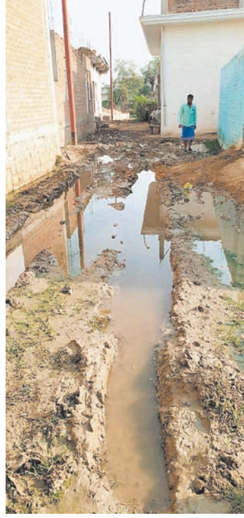
आने से इस कच्ची सड़क पर कीचड़ व जलभराव की बड़ी गम्भीर समस्या उत्पन्न हो