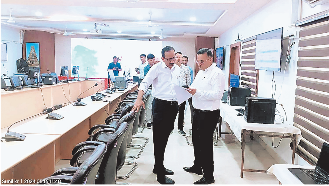
कर्मियों एवं रिजल्ट कर्मियों एवं उनके मोबाइल नम्बरों को उपलब्ध रखा जाए, ताकि आवश्यकता पड़ने पर उपयोग में लाया जा सके।

निरीक्षण के दौरान मण्डलायुक्त ने जिला प्रशासन की सराहना करते हुए निर्देश दिये कि कंट्रोल रूम के माध्यम से निर्वाचन सम्बंधी सभी गतिविधियों पर सतत निगरानी रखी जाए, साथ ही कंट्रोल रूम में आने वाली फोनकॉल का स्पष्ट जवाब दिया जाए एवं रिजल्ट में दर्ज भी किया जाए। उन्होंने यह भी निर्देश दिये कि मतदान पार्टियों में लगे