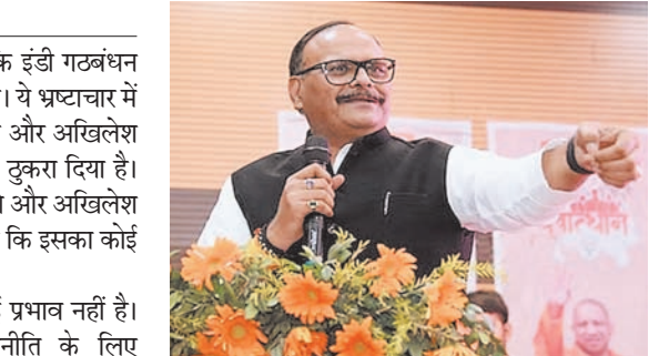
संयुक्त प्रेसवार्ता को संबोधित किया था। गुरुवार को दिल्ली के सीएम अरविंद केजरीवाल और अखिलेश यादव ने संयुक्त प्रेसवार्ता कर इंडिया गठबंधन की जीत के दावे किए।

सत्ता सुधार ■ लखनऊ उप मुख्यमंत्री ब्रजेश पाठक ने कहा कि इंडी गठबंधन लोकसभा चुनाव में फलाप साबित होगा। ये घटनाक्रम में डूबे हुए लोगों का समूह है। राहुल गांधी और अखिलेश यादव को अपने ही प्रदेश में जनता ने ठुकरा दिया है। उन्होंने कांग्रेस अध्यक्ष मल्लिकार्जुन खरगे और अखिलेश यादव की संयुक्त प्रेस कॉन्फ्रेंस पर कहा कि इसका कोई मतलब नहीं है।