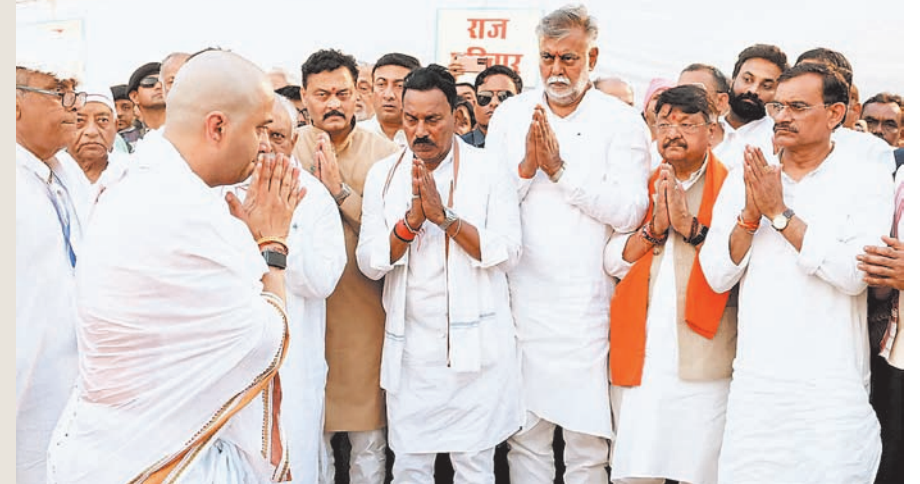
राजमाता माधवीराजे सिंधिया को श्रद्धांजलि देने पहुंचे कैलाश विजयवर्गीय, प्रहलाद पटेल समेत कई मंत्रियों ने केंद्रीय मंत्री ज्योतिरादित्य सिंधिया को सांत्वना दी और उनकी माताश्री के पर निधन दुख व्यक्त किया।