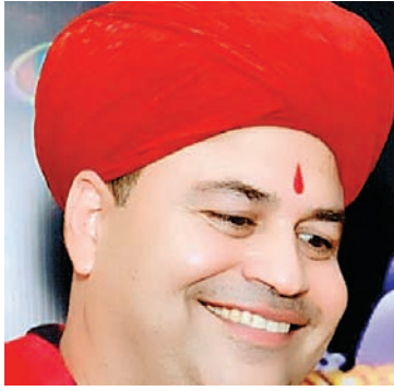
सत्ता सुधार ■ हरदा