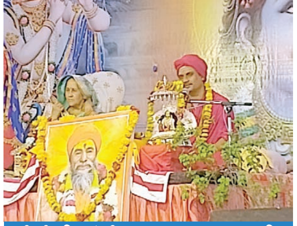
सती की बगिया में श्रीमद् भगवत कथा का छठवां दिन