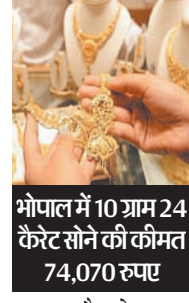
भोपाल में 10 ग्राम 24 कैरेट सोने की कीमत 74,070 रुपए

नई दिल्ली। सोना और चांदी के भाव में गुरुवार को एक बार फिर बढ़त दिखी। कारोबार के दौरान 10 ग्राम सोना 541 रुपए महंगा होकर 73,475 रुपए का हो गया। चांदी ने अपना नया ऑल टाइम हाई बनाया है। ये 1,195 रुपए महंगी होकर 85,700 रुपए प्रति किलो ग्राम पर पहुंच गई। वहीं सोने का ऑल टाइम हाई 73,596 रुपए का है जो उसने बीते महीने 19 अप्रैल को बनाया था। भोपाल सहित चार महानगरों की बात करें तो दिल्ली में 10 ग्राम 22 कैरेट सोने की कीमत 68,000 रुपए और 10 ग्राम 24 कैरेट सोने की कीमत 74,170 रुपए है। मुंबई में 10 ग्राम 22 कैरेट सोने की कीमत 67,850 रुपए और 10 ग्राम 24 कैरेट सोने की कीमत 74,020 रुपए है। कोलकाता में 10 ग्राम 22 कैरेट गोल्ड की कीमत 67,850 रुपए और 24 कैरेट 10 ग्राम सोने की कीमत 74,020 रुपए है। चेन्नई में 10 ग्राम 22 कैरेट सोने की कीमत 67,950 रुपए और 10 ग्राम 24 कैरेट सोने की कीमत 74,130 रुपए है। वहीं मद्रास की राजधानी भोपाल में 10 ग्राम 22 कैरेट सोने की कीमत 67,900 रुपए और 10 ग्राम 24 कैरेट सोने की कीमत 74,070 रुपए है।