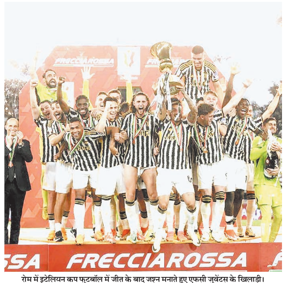
रोम में इटैलियन कप फुटबॉल में जीत के बाद जश्न मनाते हुए एफसी जूवेंटस के खिलाड़ी।