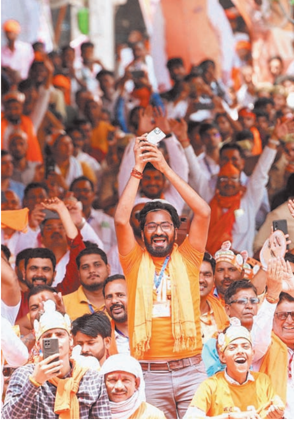
आजमगढ़ में आयोजित जनसभा को संबोधित किया। इस दौरान उन्होंने सपा-कांग्रेस के साथ इंडी गठबंधन पर जमकर निशाना साधा।

साथ ही सरकार की विभिन्न योजनाओं को लेकर जनता को जानकारी भी दी। मोदी जनसभा में मौजूद लोगों को हंसाते भी रहे।