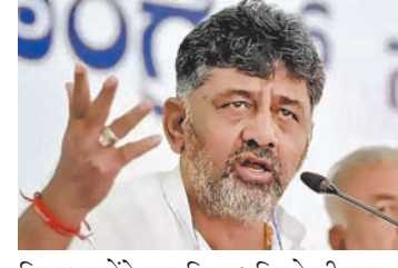
किया। उन्होंने कहा कि 10 किलो फ्री राशन, 200 यूनिट मुफ्त बिजली, महिलाओं को 2000 रुपए प्रतिमाह, महिलाओं को निःशुल्क बस यात्रा और युवाओं को रोजगार दे रहे हैं। उन्होंने साफ किया कि कर्नाटक में पांच किलो राशन और पांच किलो का पैसा दे रहे हैं। अगर इंडिया गठबंधन की सरकार केंद्र में बनी तो ये सभी गारंटियां पूरे देश में लागू करेंगे। केंद्र और यूपी की सरकार बताए उन्होंने 10 साल में क्या किया? युवा बेरोजगारी है।