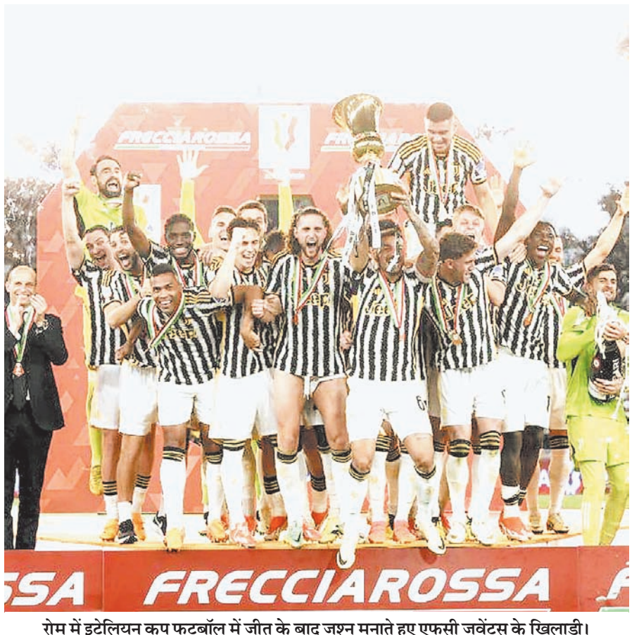
रोम में इटैलियन कप फुटबॉल में जीत के बाद जश्न मनाते हुए एफसी जूवेंटस के खिलाड़ी।