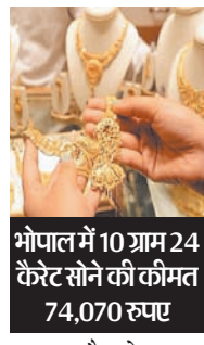
भोपाल में 10 ग्राम 24 कैरेट सोने की कीमत 74,070 रुपए

नई दिल्ली। सोना और चांदी के भाव में गुरुवार को एक बार फिर बढ़त देखी। कारोबार के दौरान 10 ग्राम सोना 541 रुपए महंगा होकर 73,475 रुपए का हो गया। चांदी ने अपना नया ऑल टाइम हाई बनाया है। ये 1,195 रुपए महंगी होकर 85,700 रुपए प्रति किलो ग्राम पर पहुंच गई। वहीं सोने का ऑल टाइम हाई 73,596 रुपए का है जो उसने बीते महीने 19 अप्रैल को बनाया था। भोपाल सहित चार महानगरों की बात करें तो दिल्ली में 10 ग्राम 22 कैरेट सोने की कीमत 68,000 रुपए और 10 ग्राम 24 कैरेट सोने की कीमत 74,170 रुपए है। मुंबई में 10 ग्राम 22 कैरेट सोने की कीमत 67,850 रुपए और 10 ग्राम 24 कैरेट सोने की कीमत 74,020 रुपए है। कोलकाता में 10 ग्राम 22 कैरेट गोल्ड की कीमत 67,850 रुपए और 24 कैरेट 10 ग्राम सोने की कीमत 74,020 रुपए है। चेन्नई में 10 ग्राम 22 कैरेट सोने की कीमत 67,950 रुपए और 10 ग्राम 24 कैरेट सोने की कीमत 74,130 रुपए है। वहीं मद्रास की राजधानी भोपाल में 10 ग्राम 22 कैरेट सोने की कीमत 67,900 रुपए और 10 ग्राम 24 कैरेट सोने की कीमत 74,070 रुपए है।