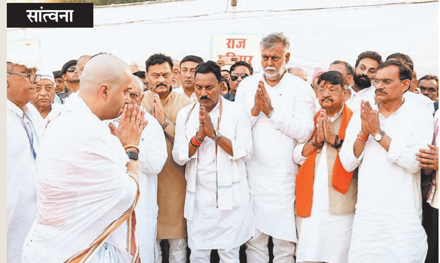
राजमाता माधवीराजे सिंधिया को श्रद्धांजलि देने पहुंचे कैलाश विजयवर्गीय, प्रहलाद पटेल समेत कई मंत्रियों ने केंद्रीय मंत्री ज्योतिरादित्य सिंधिया को सात्वना दी और उनकी माताश्री के पर निधन दुःख व्यक्त किया।

कि राजमाता जी का यूनाना ग्वालियर और सिंधिया परिवार ही नहीं प्रदेश के लिए एक छति है। इस दुखी की घड़ी में हम सिंधिया परिवार के सहभागी हैं। मैं श्रद्धांजलि देने आया हूँ, मां का जाना किसी भी व्यक्ति के लिए बहुत ही दुखद होता है। हमारे नेता ज्योतिरादित्य सिंधिया की माता का निधन हुआ है। राजमाता का निधन हुआ है, यह बहुत दुख की घड़ी है। हम सिंधिया परिवार के साथ इस दुख की घड़ी में सहभागी हैं।