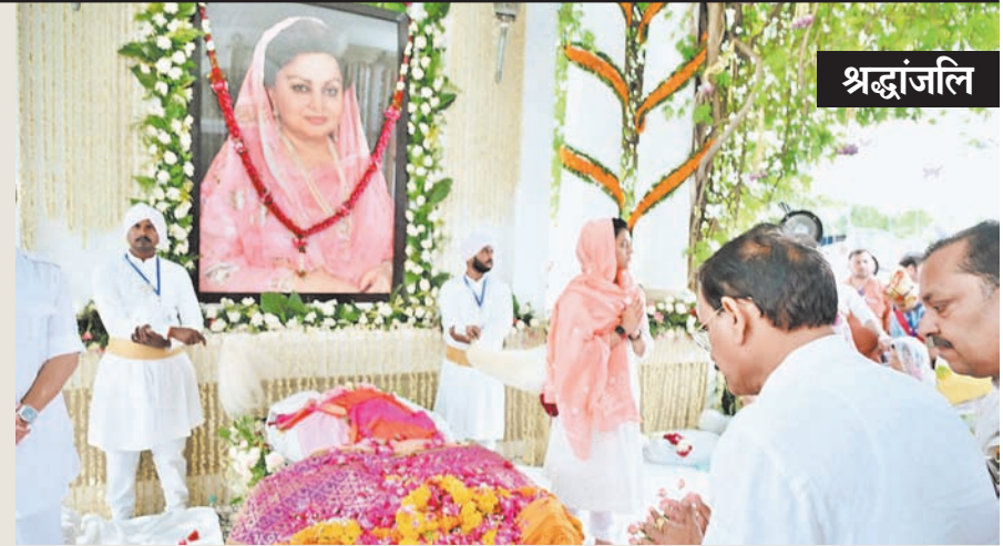
राजमाता श्रीमंत माधवीराजे सिंधिया को भाजपा प्रदेश अध्यक्ष वीडी शर्मा ने फूल अर्पित कर श्रद्धांजलि दी।

सत्ता सुधार ■ भोपाल, ग्वालियर सीएम मोहन यादव ने राजमाता को श्रद्धांजलि दी। उन्होंने कहा, हमारे केंद्रीय मंत्री ज्योतिरादित्य सिंधिया की माता जी का दुखद निधन हुआ है। मैं अपनी और मध्यप्रदेश सरकार की ओर से शोक संवेदना व्यक्त करता हूँ।