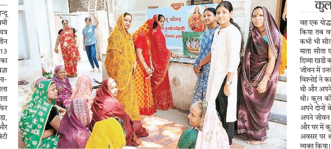
सत्ता सुधार ■ हरदा