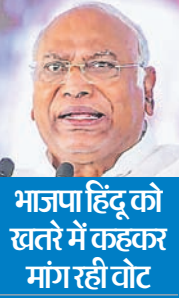
भाजपा हिंदू को खतरे में कहकर मांग रही वोट

गांधी, पटेल के बनाए देश को बचाने की है। उनकी उसे खत्म करने की है। वे अपने उद्योगपति मित्रों को लाभ देते हैं। हम गरीबों, किसानों की मदद करते हैं, उनका कर्ज माफ करते हैं। उन्होंने कहा कि हमारी पांच गारंटी हैं जो युवाओं को नौकरी, महिलाओं के खाते में साल में एक लाख, कर्ज माफी और बेरोजगार युवकों के अप्रेंटिस सुनिश्चित करती है। इसके इतर भाजपा की गारंटी नफरत और भाईचारे को खत्म करने की है। भाजपा अपने काम पर नहीं राम नाम पर वोट मांगती है।