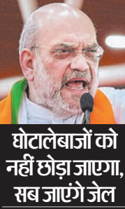
घोटालेबाजों को नहीं छोड़ा जाएगा, सब जाएंगे जेल

अर्जी करेगा, उसे तकलीफ आएगी। मनुआ समाज के लोगों को भी आश्चर्य करने आया हूं कि किसी को कोई तकलीफ नहीं आएगी। नागरिकता भी मिलेगी और देश में सम्मान के साथ जी भी पाओगे। दुनिया की कोई ताकत मेरे शरणार्थी भाइयों को भारत का नागरिक बनने से रोक नहीं सकती, ये नरेन्द्र मोदी का वादा है। उन्होंने कहा कि बंगाल में कटमनी, घुसपैठ, बम धमाके और सिंडिकेट राज... ममता दीदी नहीं बंद कर सकती हैं, इसे सिर्फ मोदी ही बंद कर सकते हैं।