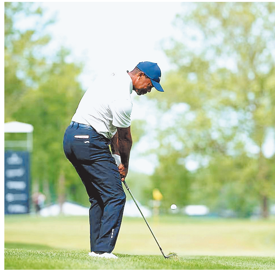
वलहाला गोल्फ क्लब में अमेरिका के लुसविले के टेंटुकी पीजीए गोल्फ चैम्पियनशिप में खेलते हुए।